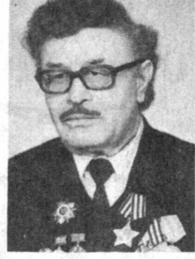
ижодий жамоаси ҳам кўп минг соғли мухтарийларимиз номидан қизин муборакбод атамиз.

Зоҳиджон Обидовнинг номи шеъринг илхомландирганга жуда яхши таниш. Ҳаётнинг кўп аччи-чучугини татиган, урушинг авезсиз ҳақиқатларини, дахшатли божаларини ўз кўзи билан кўрган жангчи-шор қаламига мансуб асарлар бугун кўнчилигини кўнгли мулғига айланган қолган.