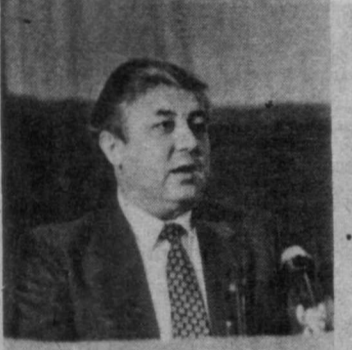
ҚАДРЛИ ёшлар! Сингиллар, укалар! Анжуманга ташриф буюрган бизнинг азиз меҳмонлар!

фунунинг тарихи ва биология музейларини бўлишди. Улар дорилфунуннинг тарихи ва ўлкамизнинг ҳайвонот ҳамда ўсимлик дуниси тўғрисида тасаввур ҳосил қилдилар. Меҳмонлар ташриф сўнггида маъқур ўқув юрти Ёшлар Иттифоқи ташкилотининг иш фаолияти билан ҳам танишдилар. (Ўз муҳбиримиз).