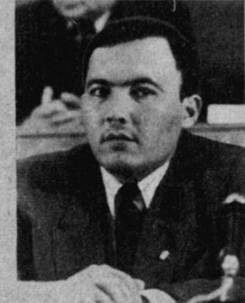
ХўРМАТЛИ қурултой қатнашчилари! Қадрли меҳмонлар!

Президентимиз қайд этганидек: «Ўзбекистон Республикаси амалий ҳамкорларга, ҳўрмат ва ишончга асослан-