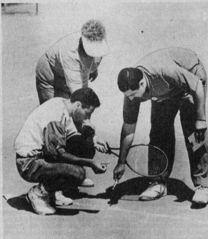
СУРАТЛАРДА: халқаро мусобақадан лавҳалар.

Қўрсатувдан жой олган, бир пайтлар қувғинга дучор бўлиб, не кўргуликларини бошдан ўтказган момолар ҳижо-ларини тинглаб этинг ушвади. Уша момолардан бири қочиб кетаётган аламидан ўзи яшаган ўтовга ўт қўйиб кетади. Бойларга қариндош ёки тегишли бўлганликлари туфайли ит азобини тортадилар.