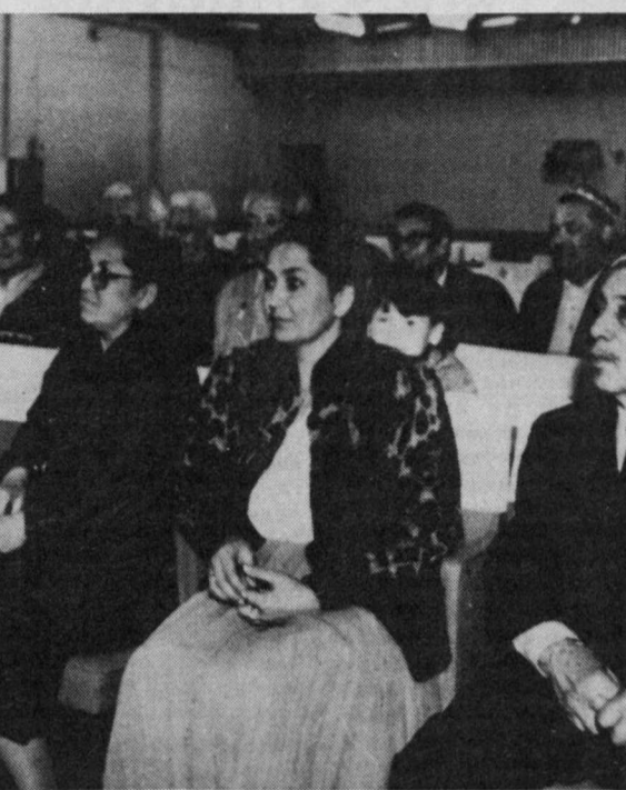
лиф қилдик. Чунки, ёшлар ҳали кўп ўқиб-ўрганиш имкониятига эгалар. Шундан экан биз ўқувчиларимизнинг ота-оналарига ҳам шундай имкониятлар яратиб беришимиз керак бўлади» дейишди улар.