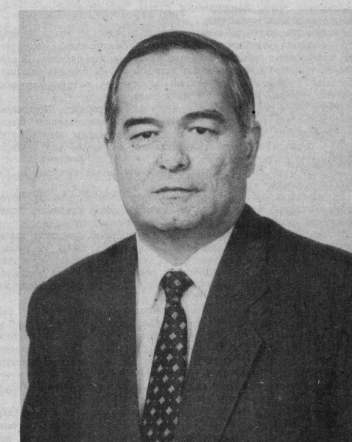
Ўзбекистон Республикаси Олий Кенгашининг ҚАРОРИ

Ўзбекистон Республикаси Президенти И. А. Каримовга «Ўзбекистон Қаҳрамони» унвонини бериш тўғрисида