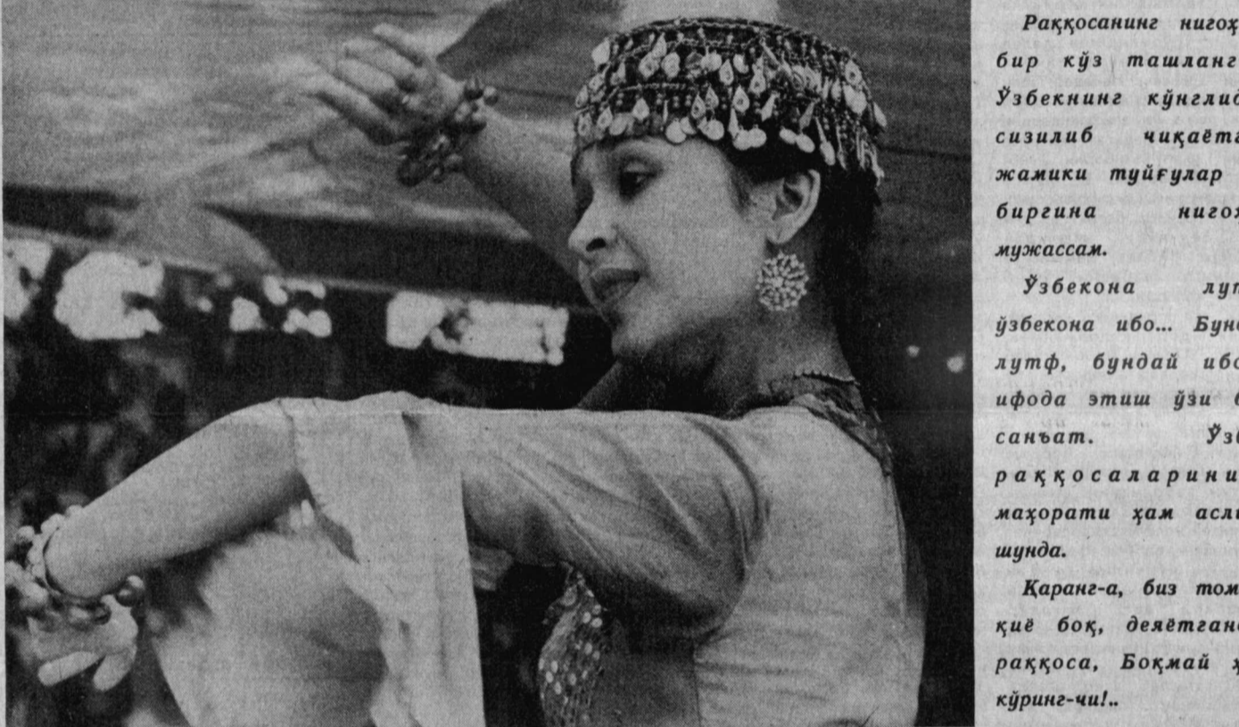
Раққосанинг нигоҳида бир кўз ташланг-а!

Ўзбекнинг кўнглидан сизилиб чиқаётган жамики туйғулар шу биргина нигоҳда мужассам.