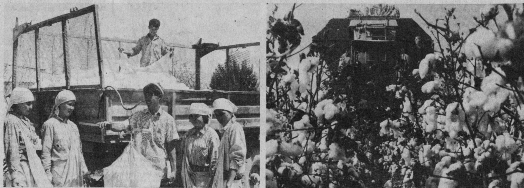
ЭТАК ТУТГАН ҚУЛЛАРГА "ПҮЛАТ ОТ"ЛАР ЕРДАМГА КЕЛИШМОҚДА.