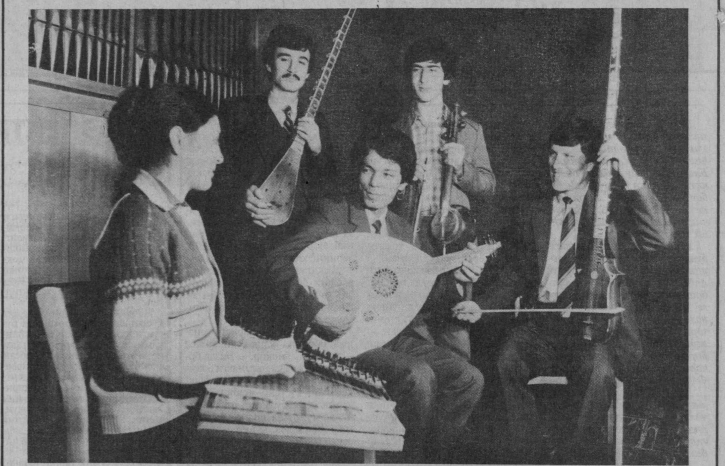
ИЖОДНИНГ ЮЛДУЗЛИ ОНЛАРИ