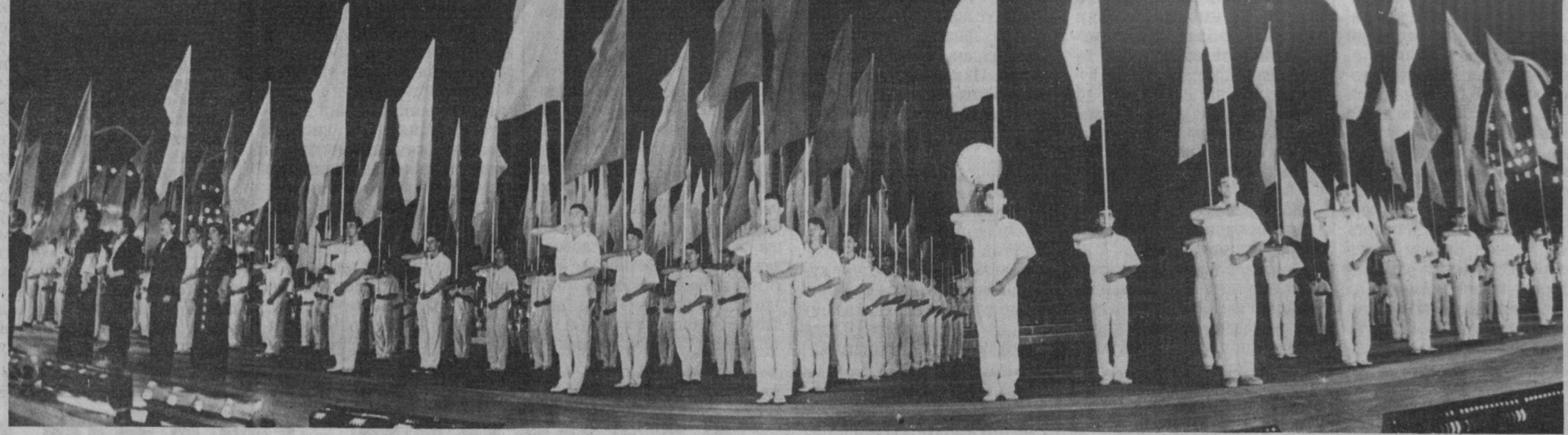
Мустақилликнинг уч йиллиги шодиёналаридан бир лаҳза.

Биз куни кеча қорақалпоғистонлик ешлар билан суҳбатлашдик. Уларнинг таъкидлашича, барчаси Президент ваколати узайтирилишини яқдиллик билан ёқлаб овоз берали. Айнан шундай ҳамжаҳатликни биз бошқа миллат вақили бўлган юртдошлар билан мулоқотда ҳам юрак-юракдан ҳис этидик. Насиб этса, келур Шому Ироқдин, Насиб эт-маса кетур қошу қабоқдин, дейди шоир. Зеро, халқимизнинг толевида қўлиб турган тотувида, осойиш — иқтисодий ислоҳот неъматлари абадий бўлсин! Биз аслида шуниятни ёқлаб ҳам овоз берамиз.