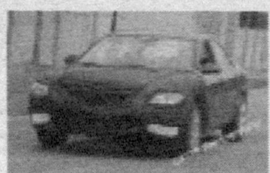
Mazda готовит новую "шестерку"

настоящим прорывом в отечественном автостроении.