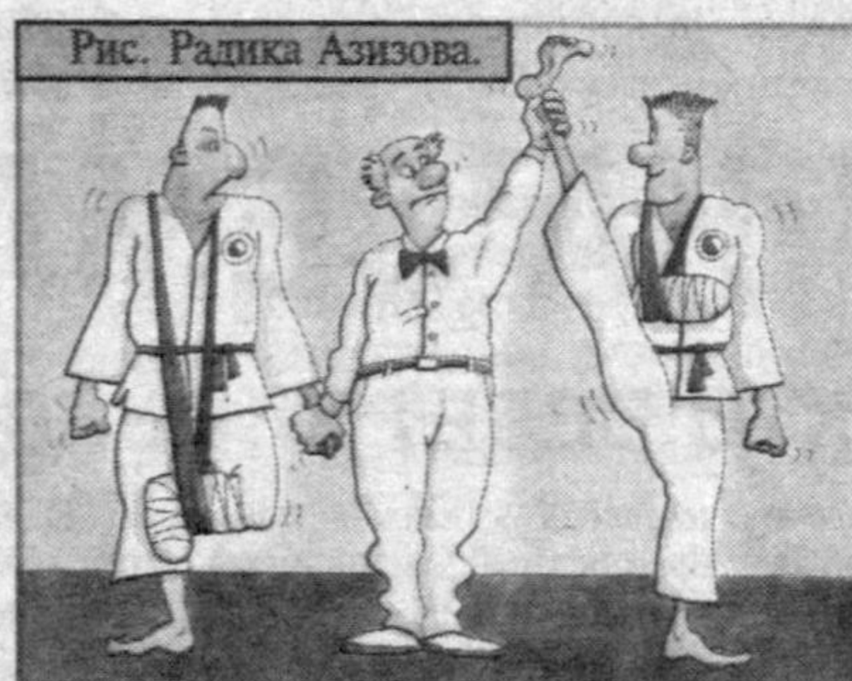
Рис. Радика Азизова.