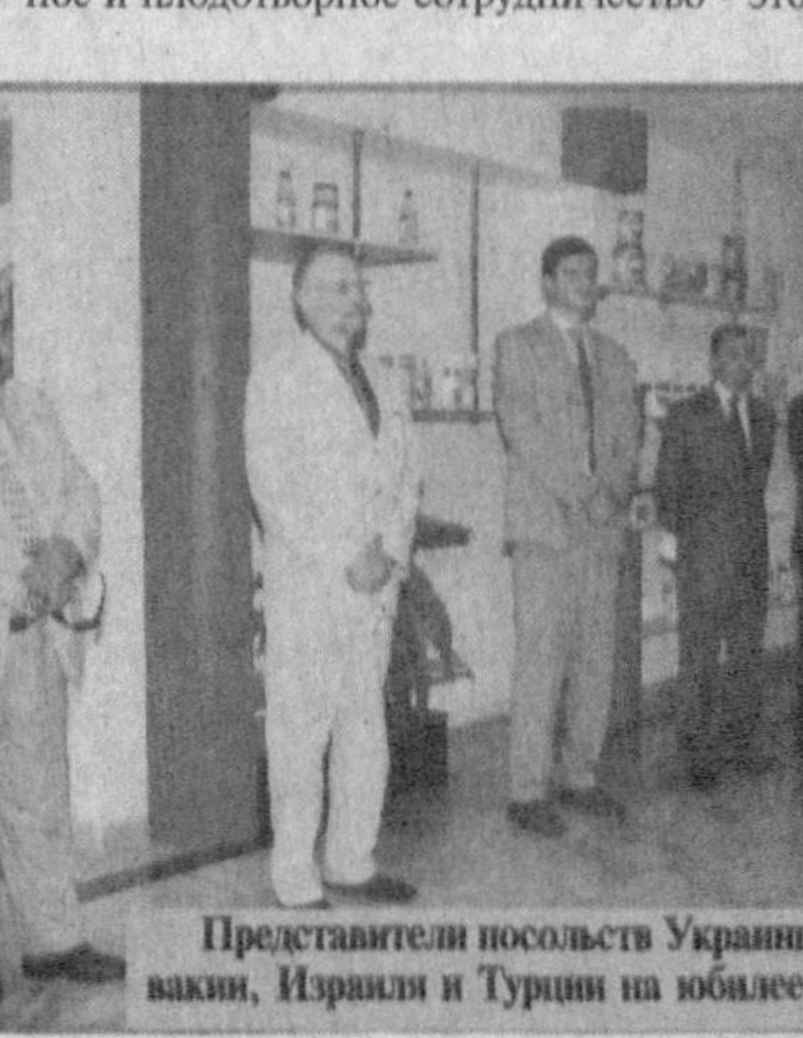
Представители посольств Украины, России, Словакии, Израиля и Турции на юбилее предприятия.

Многолетними партнерами "Lok Kolor Sintez" являются такие производственные гиганты нашей страны, как Алмалыкский и Навоийский горно-металлургические комбинаты, ОАО "Навоязот" и Ташкентский вагоно-ремонтный завод, "Узпахташ" и "Узкишлокомаш", АО "Польемник" и Бухарский нефтеперерабатывающий завод и многие другие. Долговременное и плодотворное сотрудничество - это