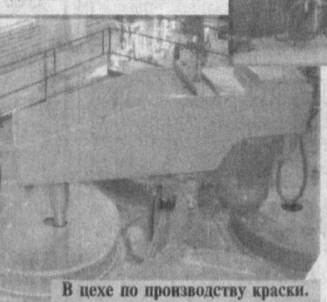
В цехе по производству краски.

Успешному продвижению СП на рынок во многом способствовал установленный здесь жесткий контроль качества выпускаемой продукции. Созданная в самом начале