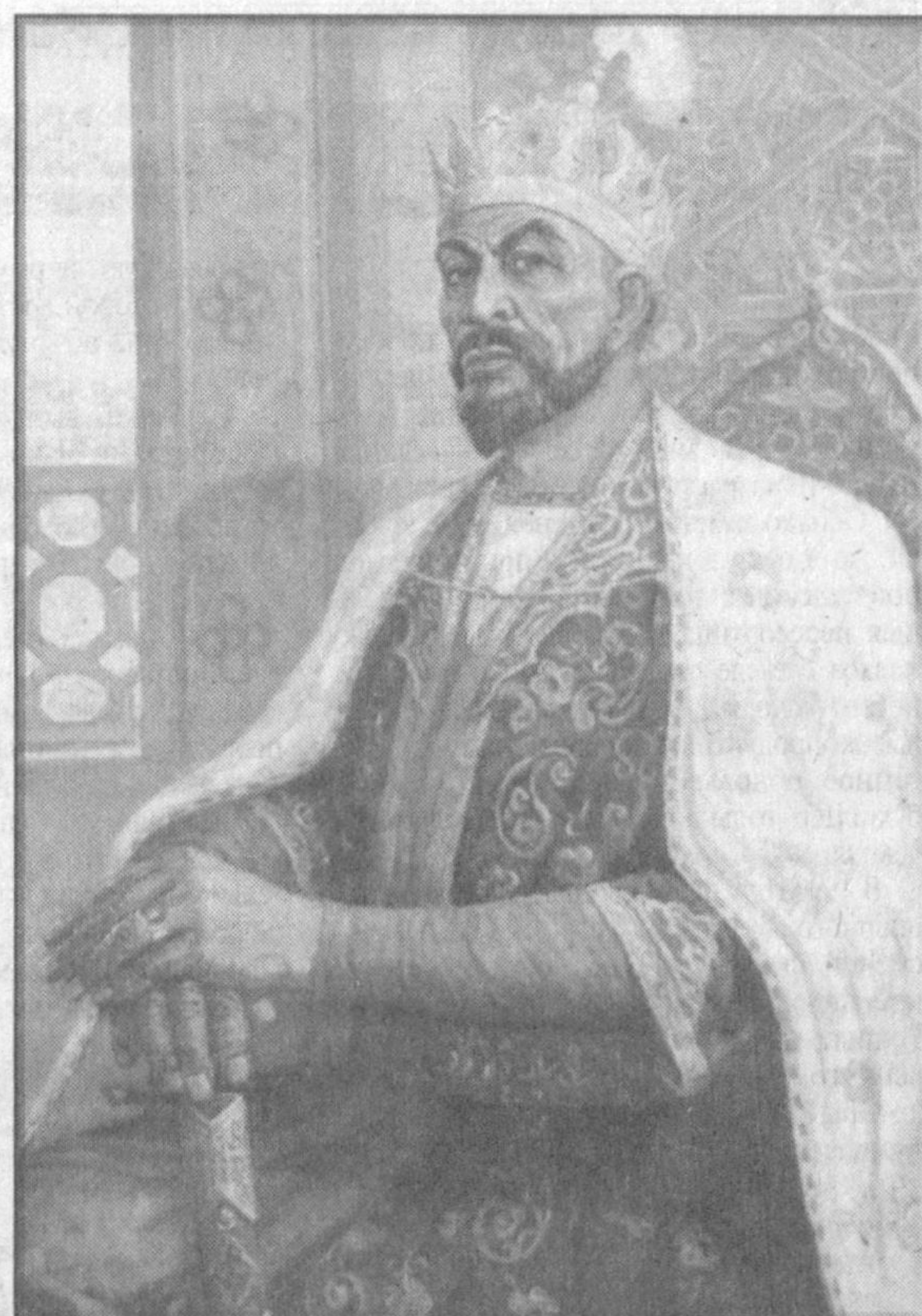
К 670-ЛЕТИЮ СО ДНЯ РОЖДЕНИЯ АМИРА ТЕМУРА