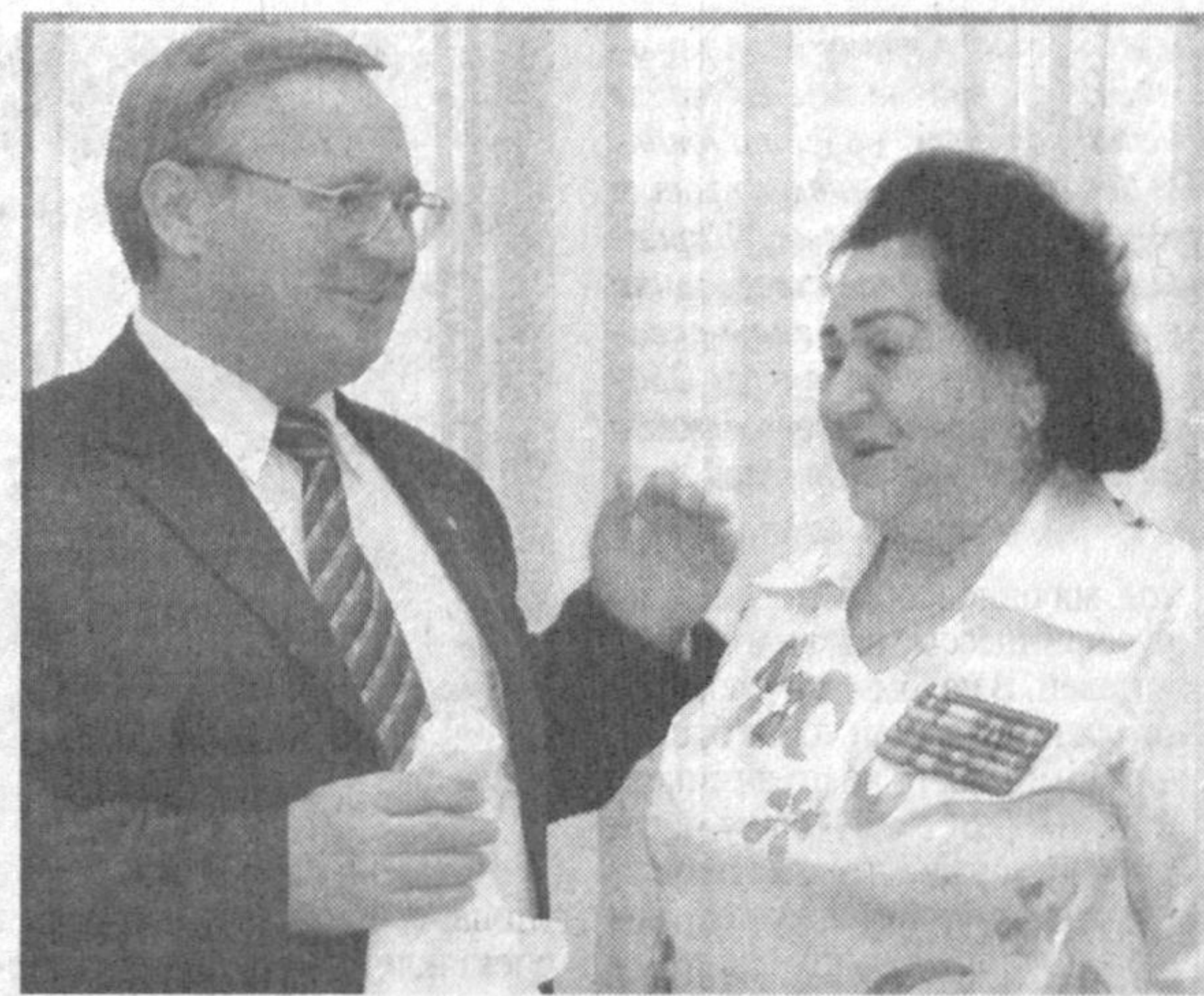
День освобождения столицы Беларуси от немецко-фашистских захватчиков навсегда останется важнейшим событием для братского народа. Уже в новейшей эпохе он стал главной датой в календаре республики. Этот день отмечается в посольстве Республики Беларусь в Узбекистане чествованием наших земляков - ветеранов Второй мировой войны, тех, кто участвовал в боях за освобождение края.

Дорогой ценой досталась белорусскому народу эта победа. Почти 80 процентов городов и деревень республики было разрушено, погиб каждый третий житель. Однако это не сломило волю к свободе. Четыреста сорок тысяч белорусских партизан и подпольщиков в тяжелейших условиях фашистской оккупации вели непрекращающуюся борьбу с захватчиками. Такого массового партизанского движения не знает история мировых войн.