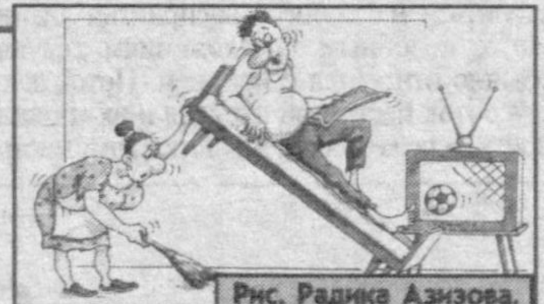
Рис. Радика Азизова.

Поэтому, когда муж и дома продолжает решать важные деловые задачи, ни в коем случае нельзя приставать к нему с вопросами: в какую школу отдавать ребенка, куда мы поедем в отпуск и будем ли мы менять квартиру. Для него это сущая мелочь по сравнению с тем, что сегодня на планерке сказал шеф по поводу соответствия его способностей и возможностей.