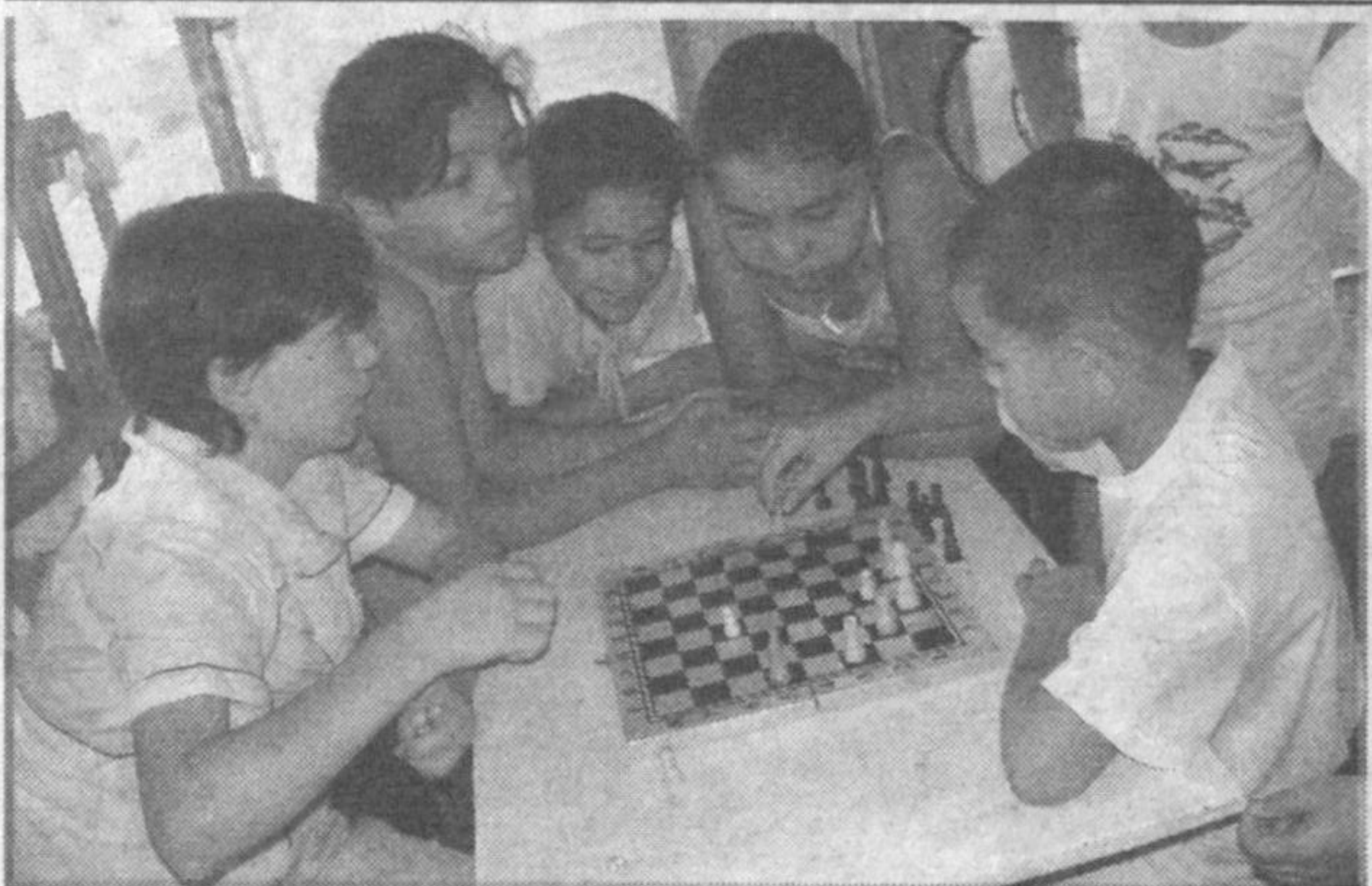
В летнем лагере, расположенном в школе №118 Яккасарайского района столицы во вторую смену отдохнут более ста детей. Ребята на спортивных площадках и в игровых комнатах весело проводят время за активными состязаниями и шахматами.