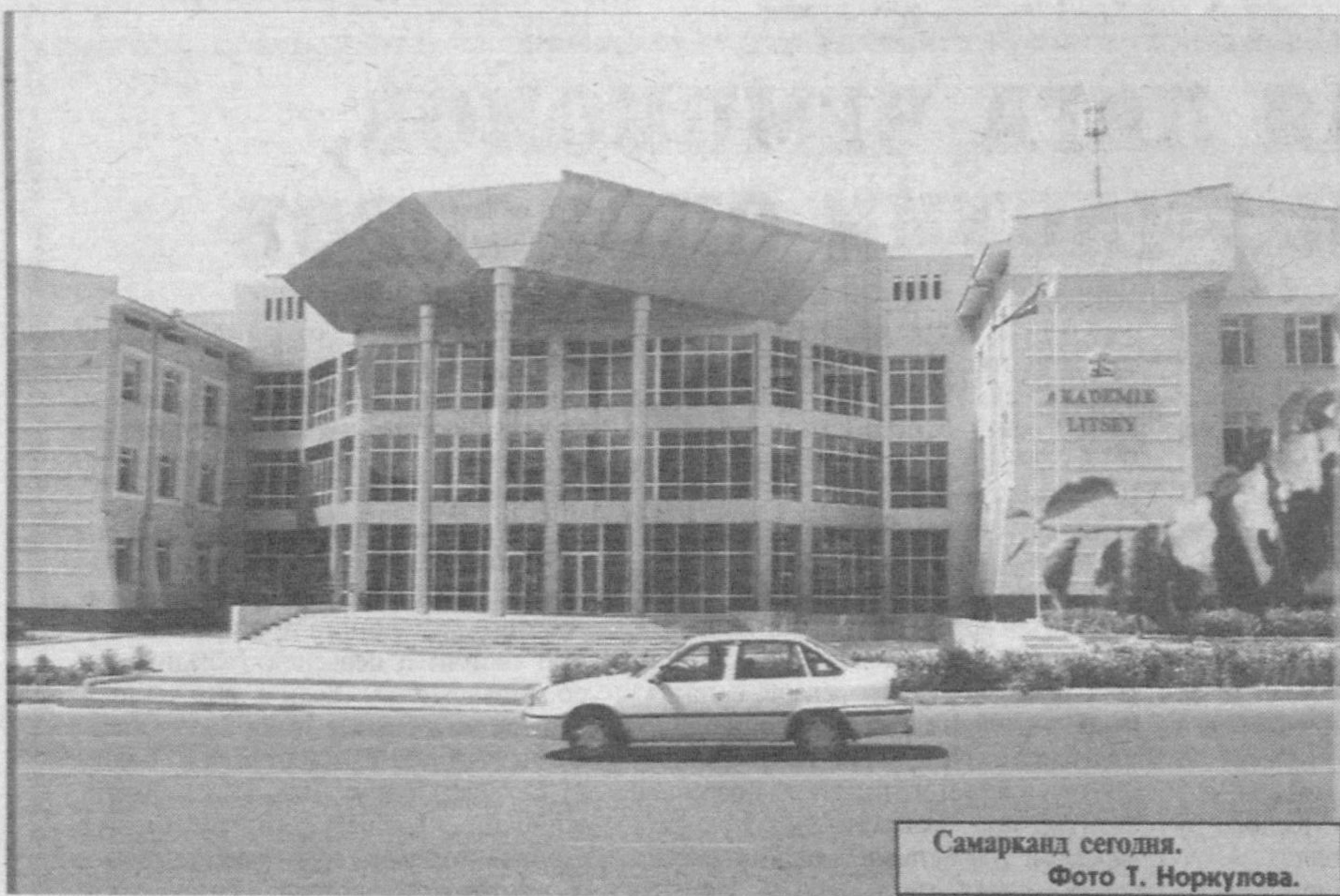
Самарканд сегодня.