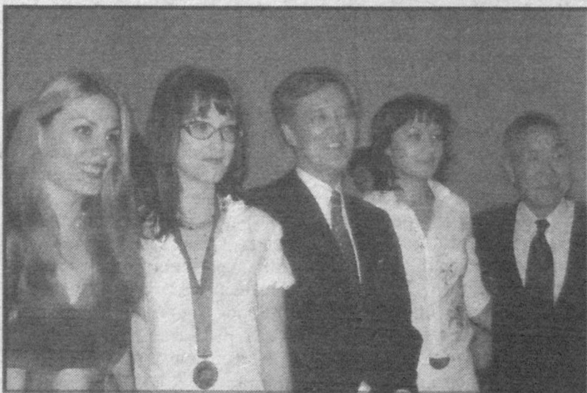
Свыше 50 молодых предпринимателей получили сертификаты биз- нес-курсов Узбекско-японского центра, подтверждающие их знания в области менеджмента, маркетинга и управления производством.

С первых дней открытия цен- тра сюда стали обращаться пред- приниматели, представители го- сударственных учреждений, что- бы перенять опыт японских биз- несменов и понять секреты эко- номического расцвета Японии. В 2001 году здесь начали дей- ствовать бизнес-курсы по четы-