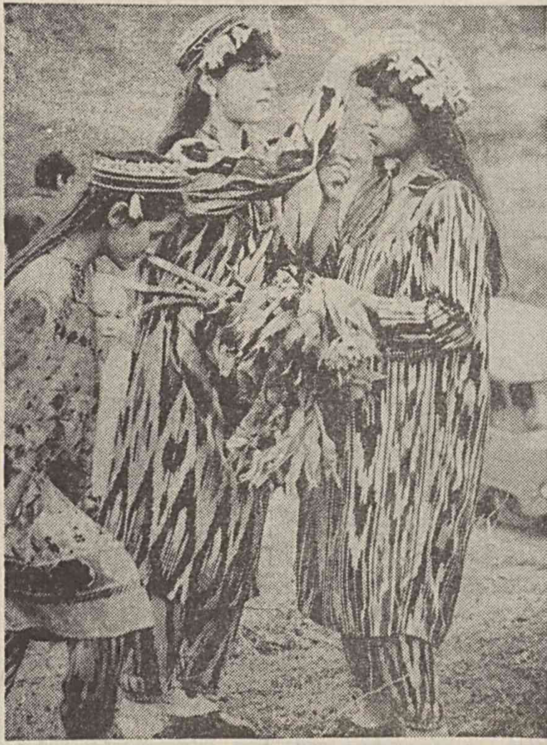
А. МАНТРОВ фотоэтойди.