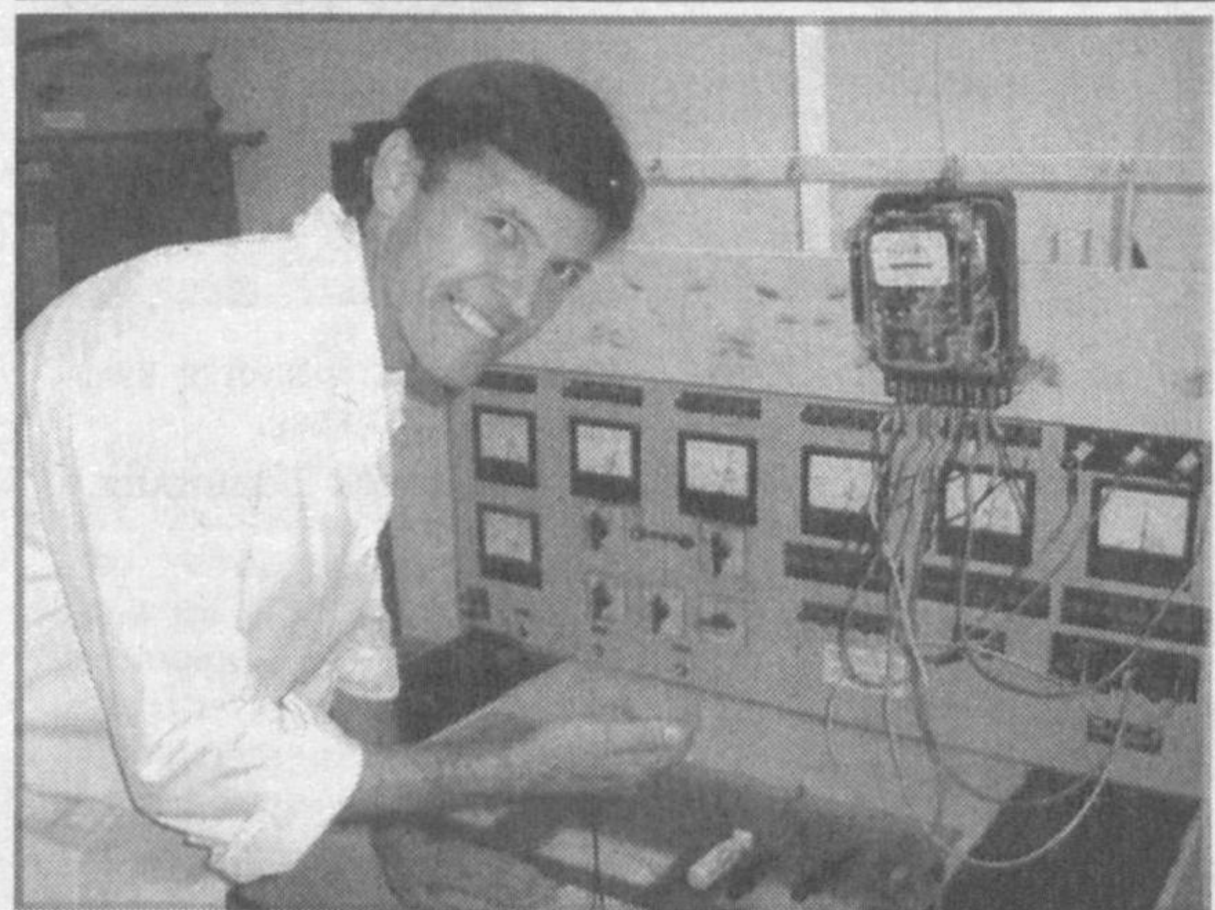
Наманганское территориальное управление стандартизации и метрологии уделяет большое внимание улучшению

качества товаров народного потребления. Именно в связи с этим на предприятии проводится мониторинг. Недостатки, выявленные на мониторинге, своевременно устраняются.