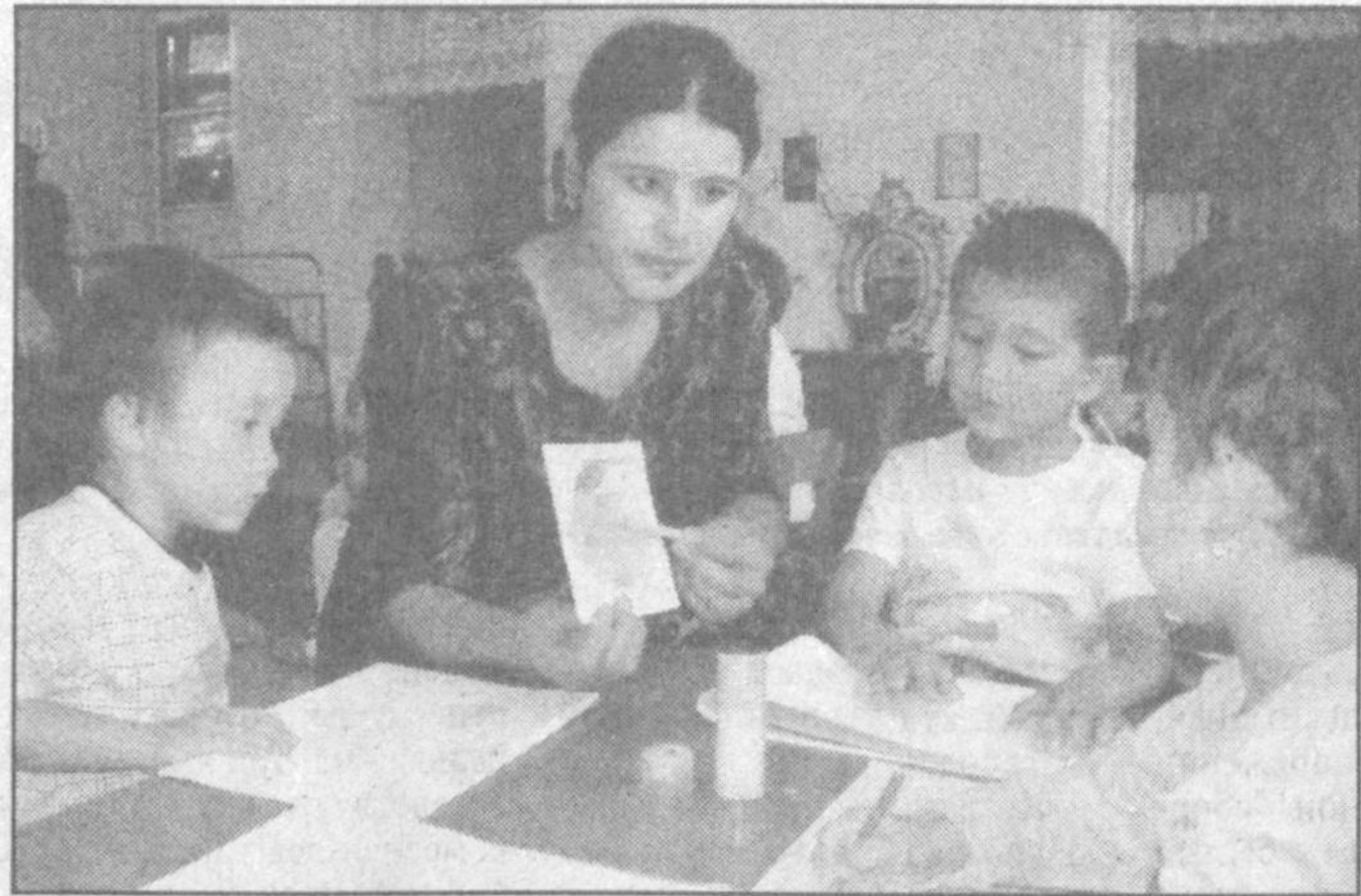
В Андижанской области трудятся более 38 тысяч педагогов. Из них около пяти тысяч с высшим образованием. Все свои силы и знания они передают своим подопечным.