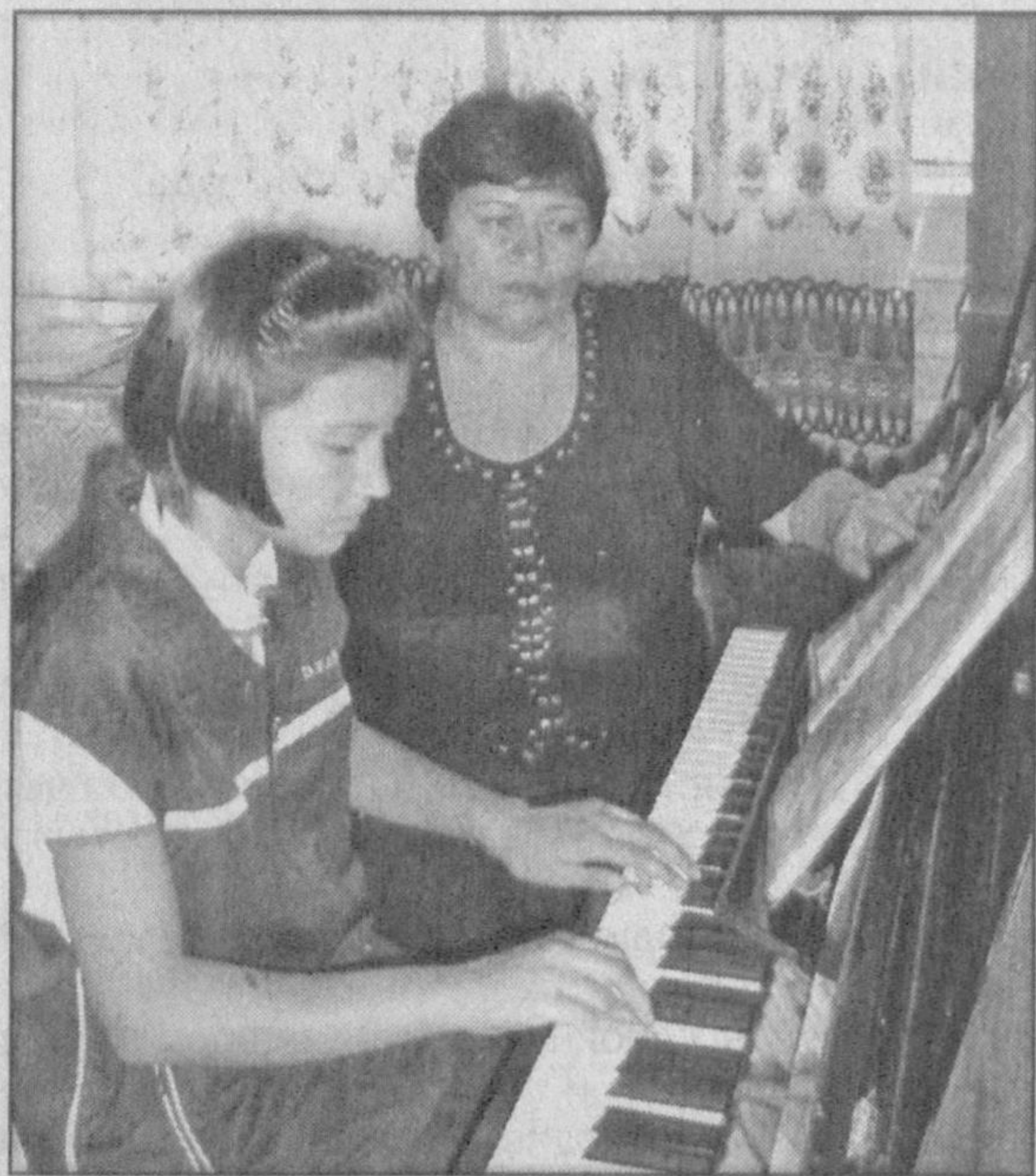
Вряд ли применительно к нашей действительности выражение: «Гении рождаются в провинции, но умирают в Париже». Талантливая личность не выбирает себе места рождения. Одно бесспорно: способному ребенку из сельской глубинки нужна большая поддержка, нежели городскому ровеснику. Немаповажли и другой аспект - эстетическое воспитание подрастающего поколения. Отвечают ли своим задачам семь школ искусств и одиннадцать музыкальных школ Кашкадары?