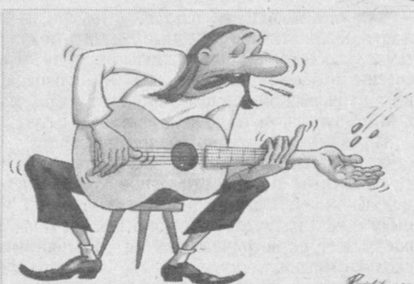
Рисунок Радика Азизова.

бананы, на следующий день смотрит - нет бананов, повесила объявление: