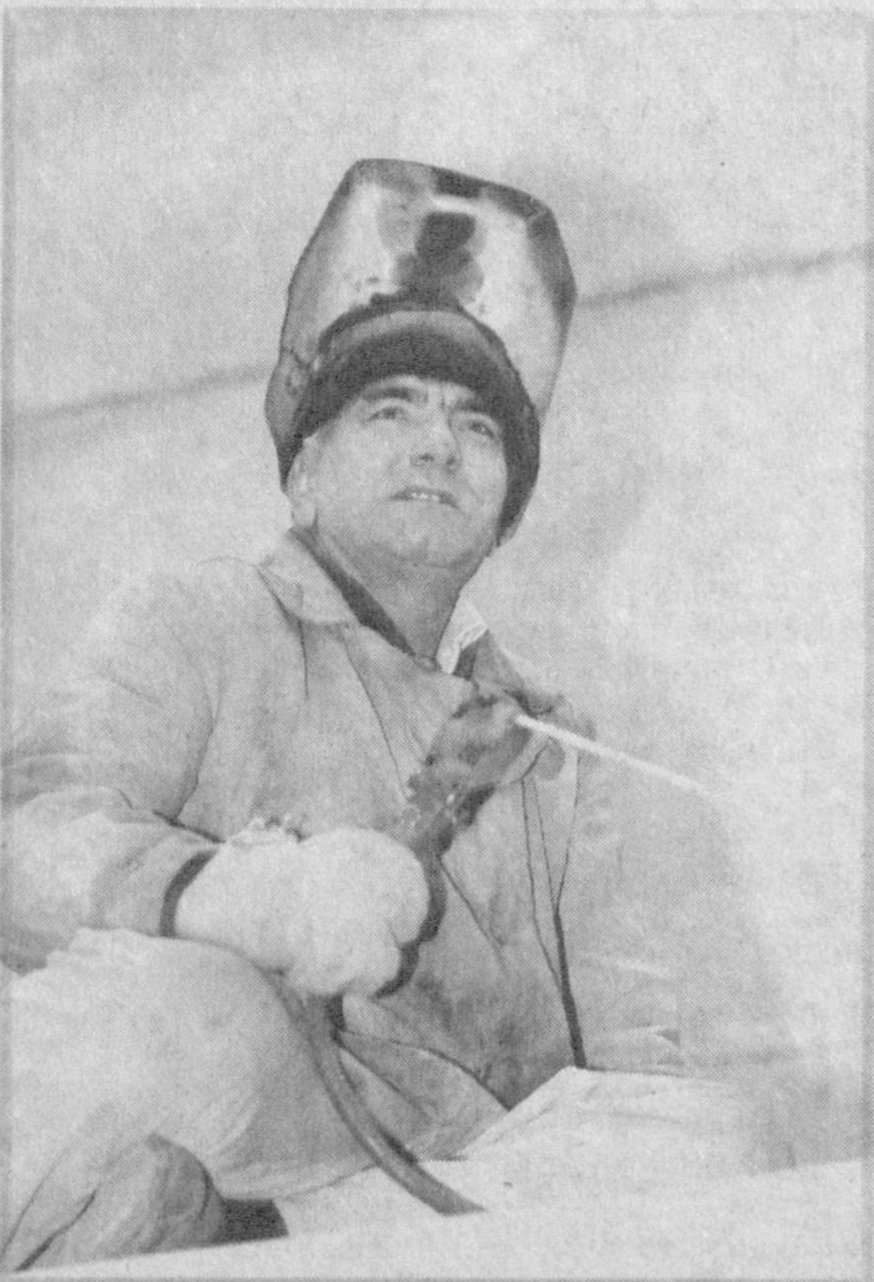
Коканд в Ферганской области считается одним из ведущих экономически развитых городов. Особенно интенсивно он развивается в последние годы.

Вступил в строй ряд предприятий. Создались благоприятные условия для развития малого бизнеса и частного предпринимательства. Благодаря инвестициям расширены многие производственные объекты, внедрены современные технологии.