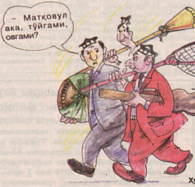
Хусан СОДИҚОВ чизган расм.

ТОШКЕНТ ҲАҚИҚАТИ Ташкентская правда Муассис: Тошкент вилояти ҳоқимлиги