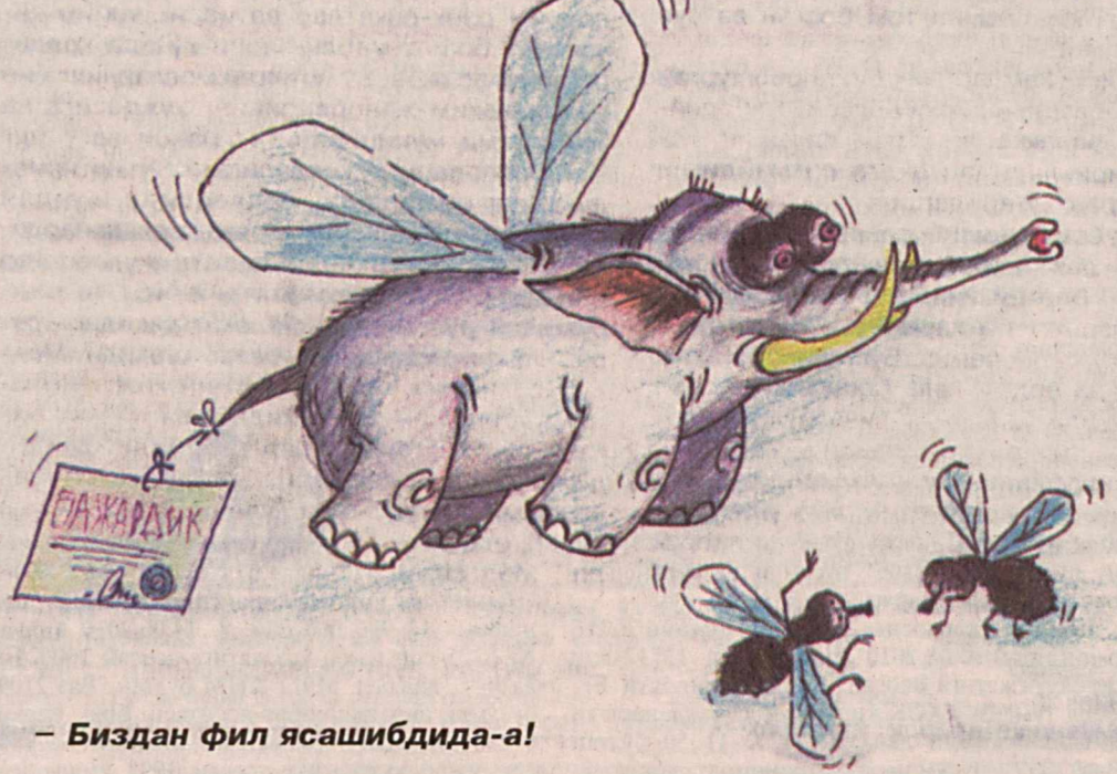
– Биздан фил ясашибдида-а! Мирсаид ҲОЗИЕВ чизган расм.