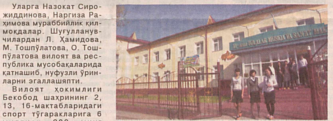
СУРАТЛАРДА: бу совғадан ўқувчилар мамнун; мусика мактабининг ҳозирги кўриниши.