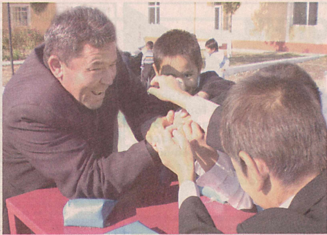
– Қани, азаматлар, ким кучли, бирми ё уч...