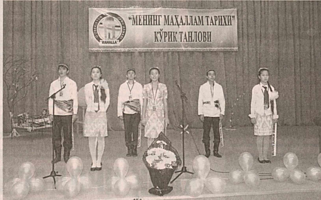
"МЕНИНГ МАҲАЛЛАМ ТАРИХИ" КҮРИК-ТАНЛОВИ

Баркамол авлод йилида бу танловда иштирок этаётган вилоятимиз ёшлари 8 мингдан ошиб кетди. Танловнинг шахар,