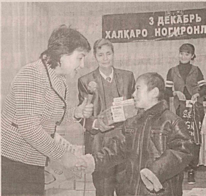
Вилоят кенгаши, вилоят маданият ва спорт ишлари бошқармаси, "Камолот" ёшлар ижтимоий ҳаракати, "Соғлом авлод учун" хайрия жамғармаси вилоят бўлими каби қатор давлат ва жамоат ташкилотлари

Пойтахтдаги VIP NBUSERVIS гузарида вилоят ҳокимлиги ҳамда "Меҳр-шафқат ва саломатлик" жамоат фонди вилоят ваколатхонаси ташкил этган "Меҳр қолур" хайрия тадбири ана шу мақсадга қаратилди. Тадбир вилоят Хотин-қизлар кўмитаси, вилоят меҳнат ва аҳолини ижтимоий муҳофаза қилиш бош бошқармаси, вилоят "Маҳалла" хайрия жамғармаси, "Сен ёлғиз эмассан" фонди, касаба уюшмалари ташкилотлари