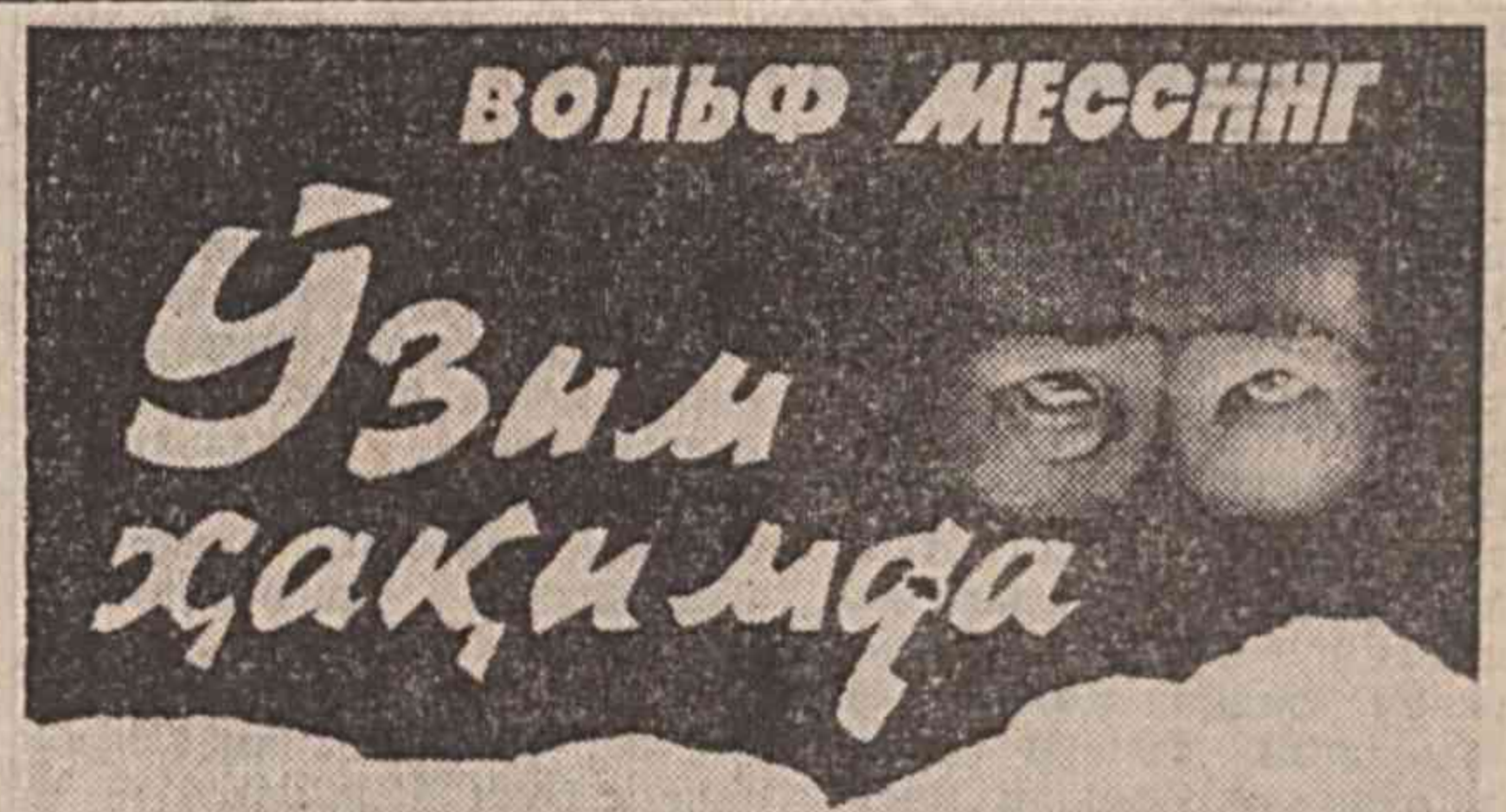
(Давоми. Боши ўтган сонларда).