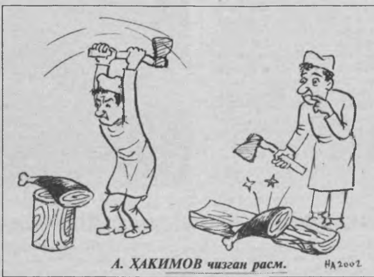
А. ҲАКИМОВ чизган расм.