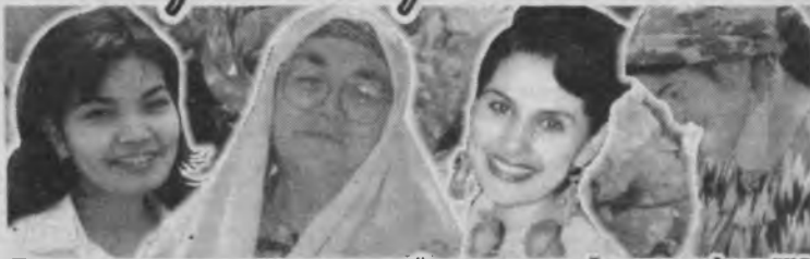
Тошкент вилояти хотин-қизлар кўнгидашнинг ойлик саҳифаси №3 (3-, 4-, 5-, 6-бетлар).