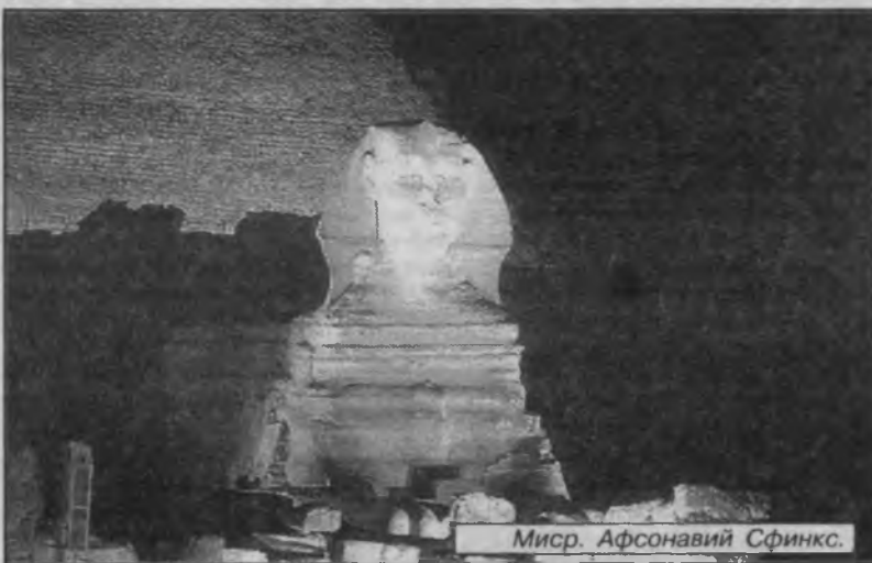
Миср. Афсонавий Сфинкс.

Олти ёшли касалманд ўглини даволаш мақсадида италиялик Ники Франческо сузувчи уй қуришни мўлжаллади. 26 метр узунликдаги бу кема Сицилия қирғоқларидан унчалик узоқ бўлмаган ерда туради, соҳилга эса фақат ёқилғи ҳамда озиқ-овқат жамлаш учунгина келиб кетилади. Гап шундаки, Н. Франческо диққинафаслик (астма)нинг галати бир тури билан оғриган боласи атрофида парвона. Денгиз сафаридан кейин болада ижобий ўзгаришларни кўрган ота-она гоёт хурсанд бўла бошладилар. Лекин, бошқа томондан ногироннинг билим олиши муаммо бўлиб қолди. Ота-она фарзандларига таълим беришда тасвирли сайёравий алоқадан фойдаланишни кўзлашмоқда.