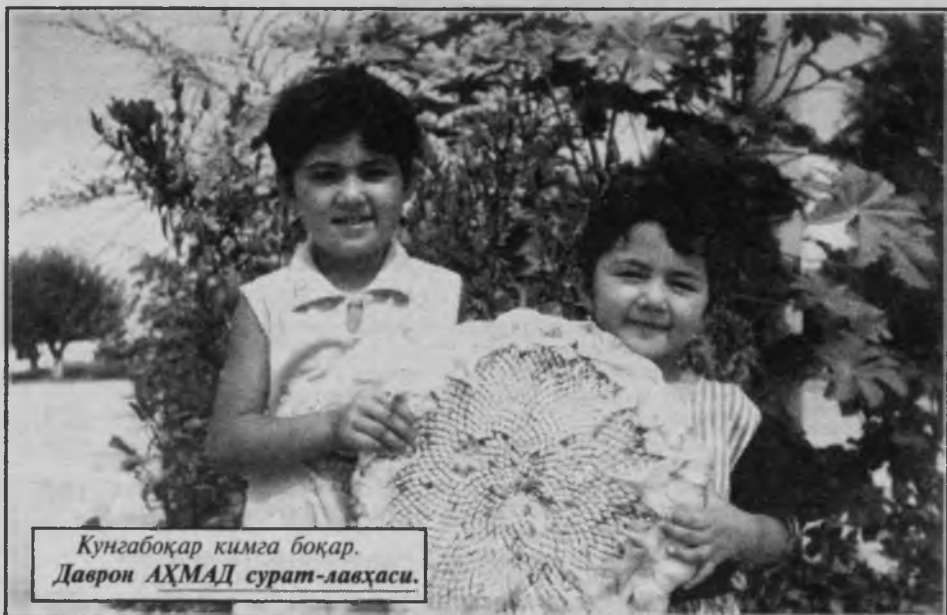
Кунгабоқар кимга боқар.