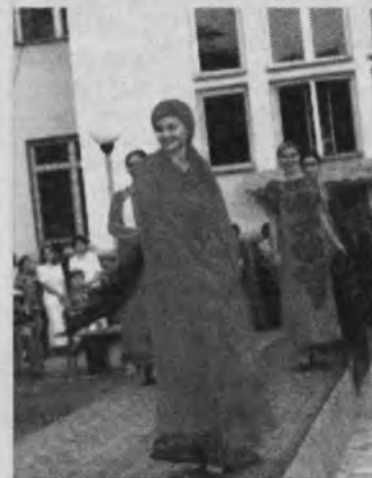
СУРАТЛАРДА: тадбирдан лавҳалар.