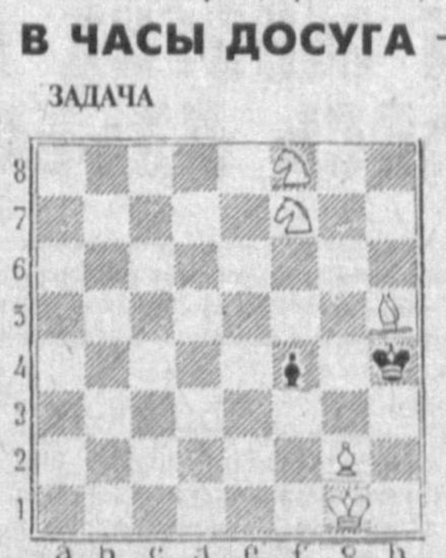
Мат в три хода.