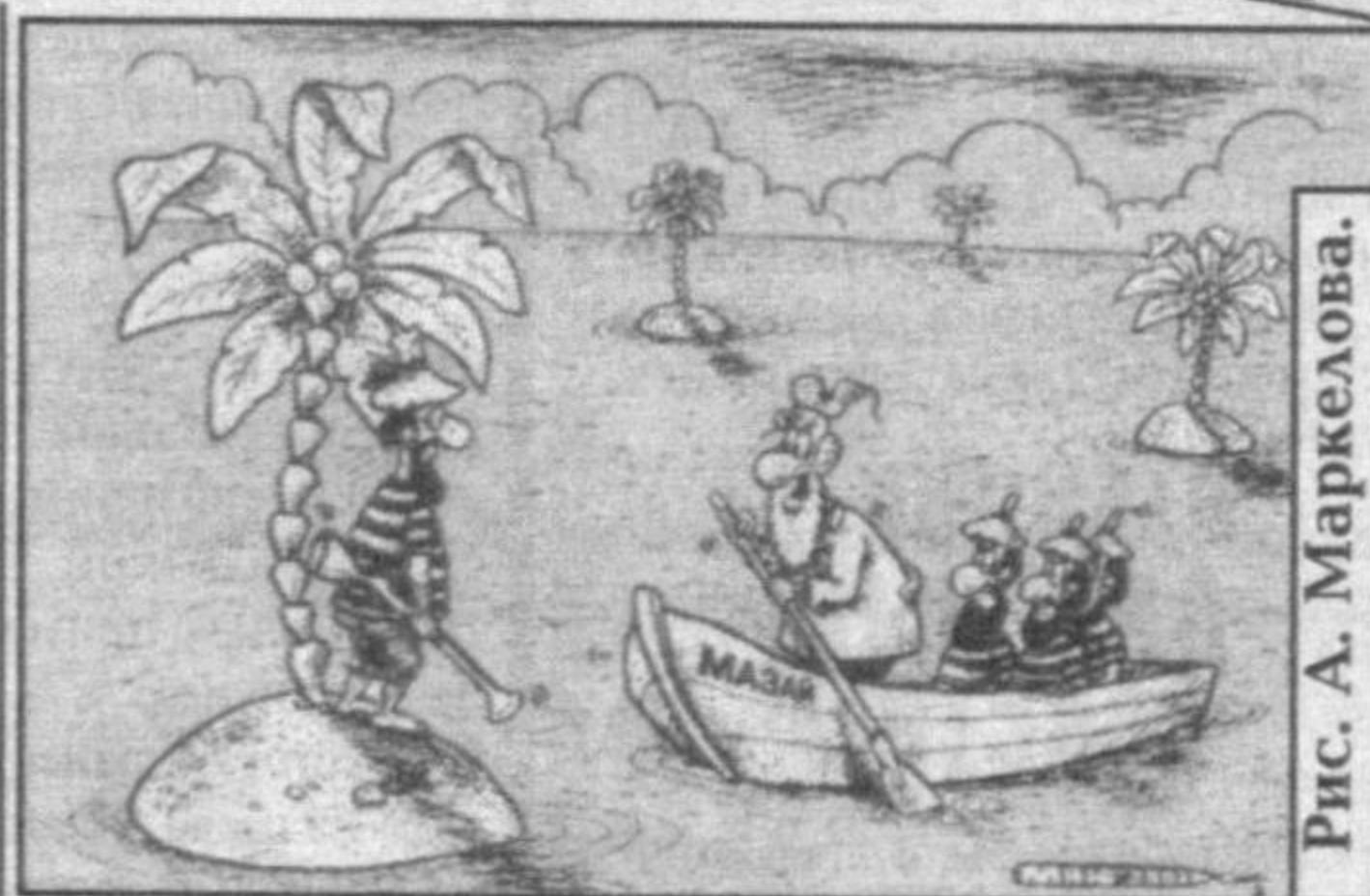
Рис. А. Маркелова.

- А я вот очень люблю, когда муж рядом. Р-я-дом, я сказала!!!