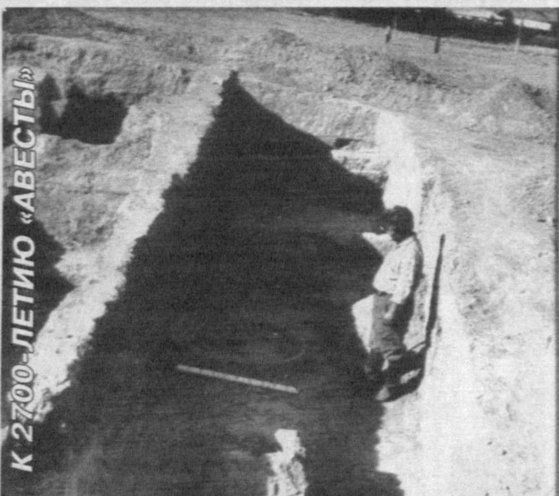
К 2700-ЛЕТИЮ «АВЕСТЫ»