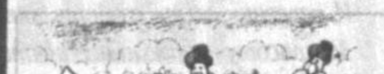
Рис. А. Маркелова.