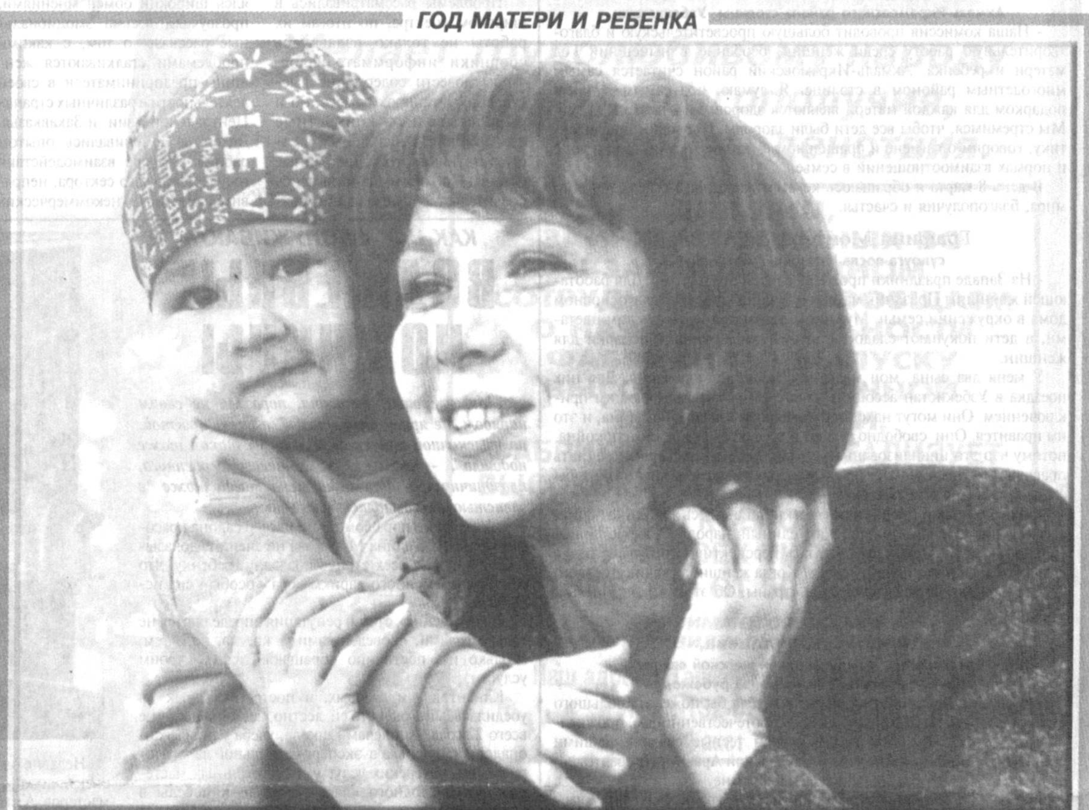
ГОД МАТЕРИ И РЕБЕНКА