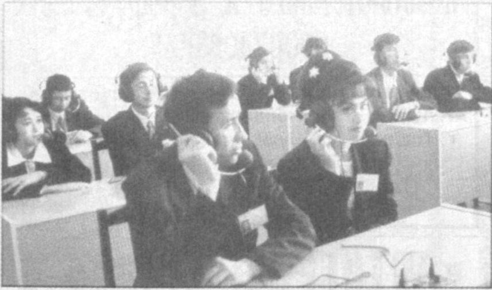
В Намангане сдан в эксплуатацию колледж транспорта и связи. Здесь будут обучаться 450 учащихся. Новое учебное заведение возвели строители треста «Наманган техноло».