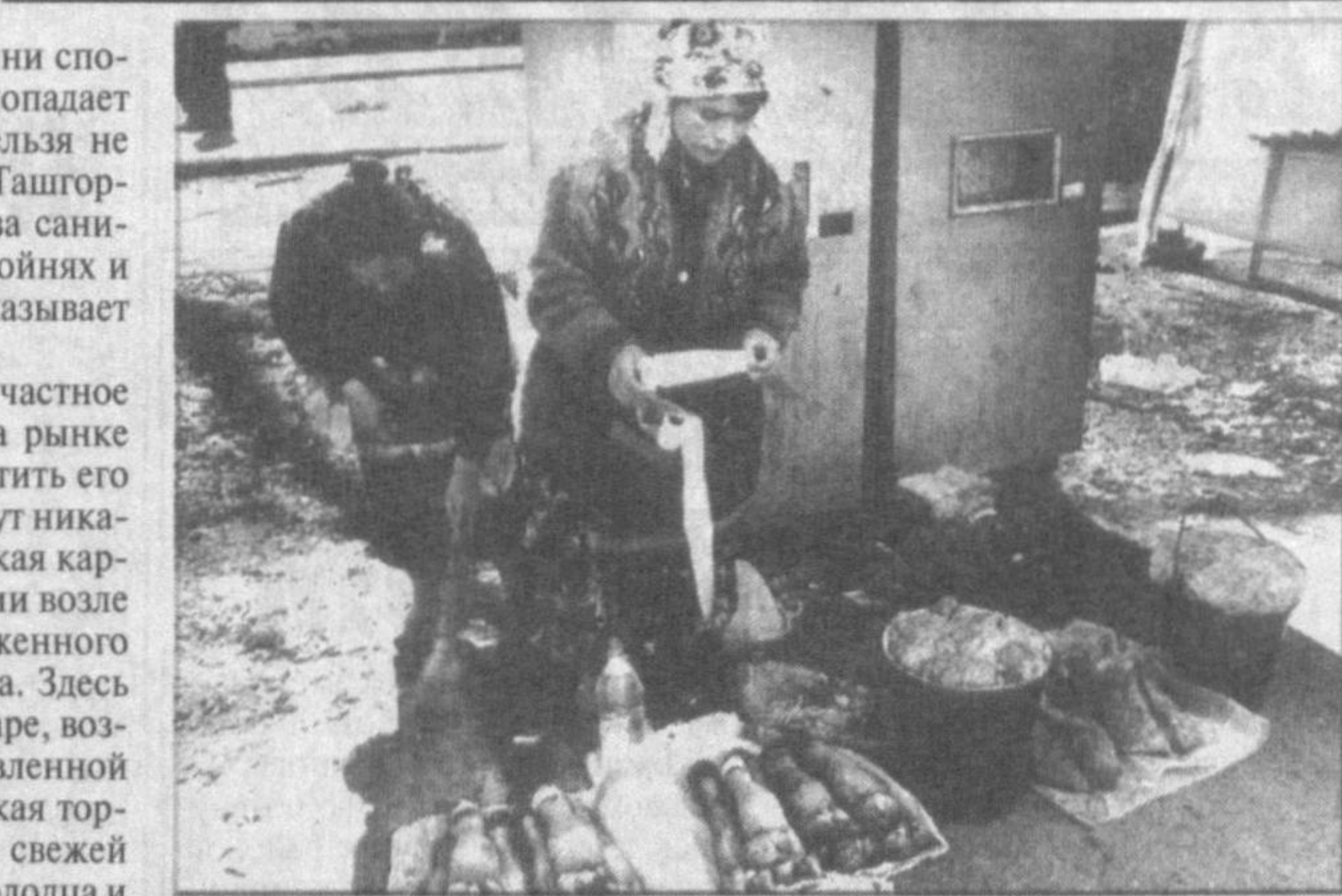
поскольку незаконная торговля идет за пределами территории рынка.

Только в мясном павильоне на рынке «Фарход бозори» в день в среднем реализуется свыше 10 тонн свежего мяса.