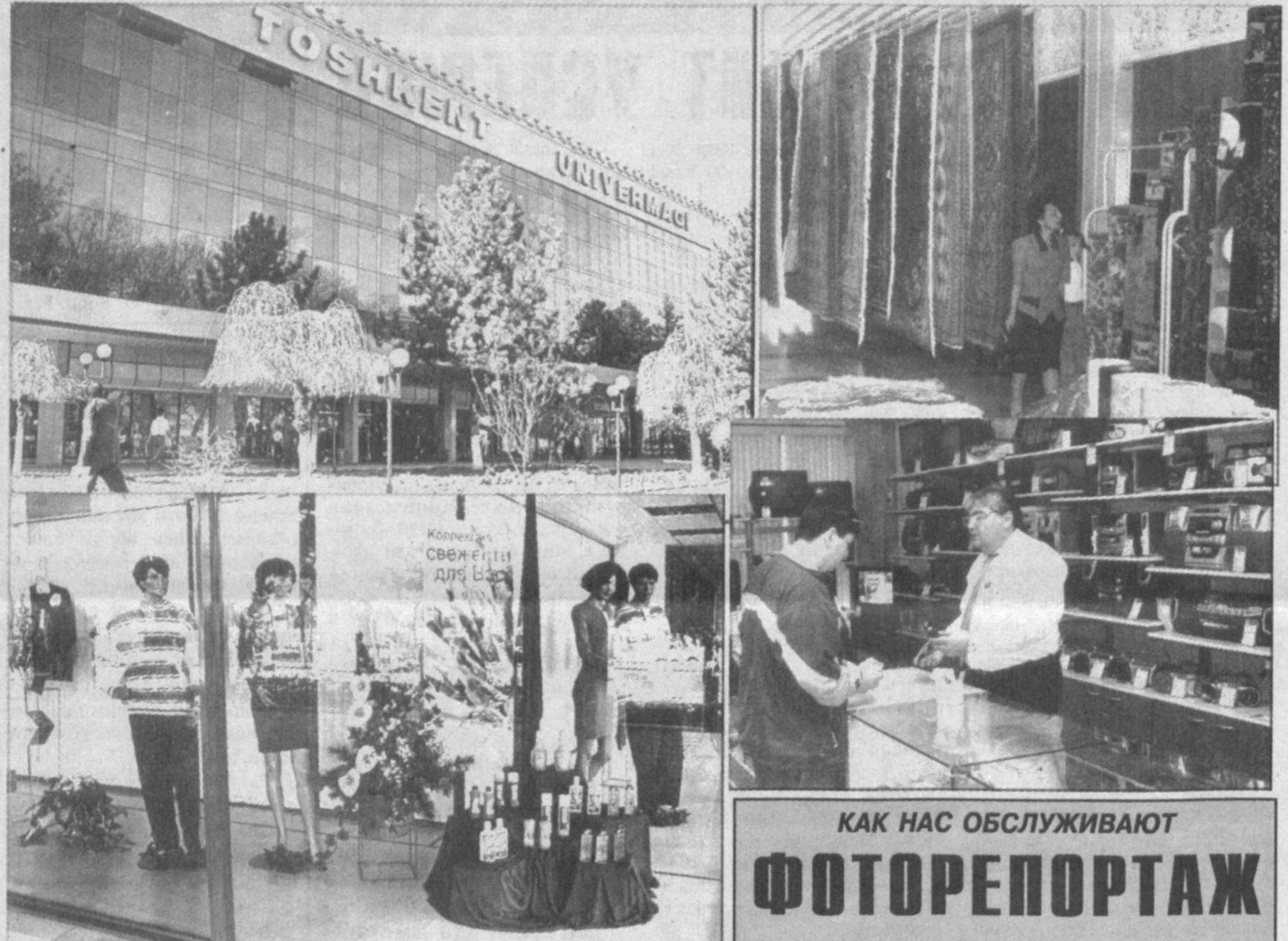
КАК НАС ОБСЛУЖИВАЮТ ФОТОРЕПОРТАЖ

Беседу записал Анатолий Байнов. Корр. «Правды Востока».