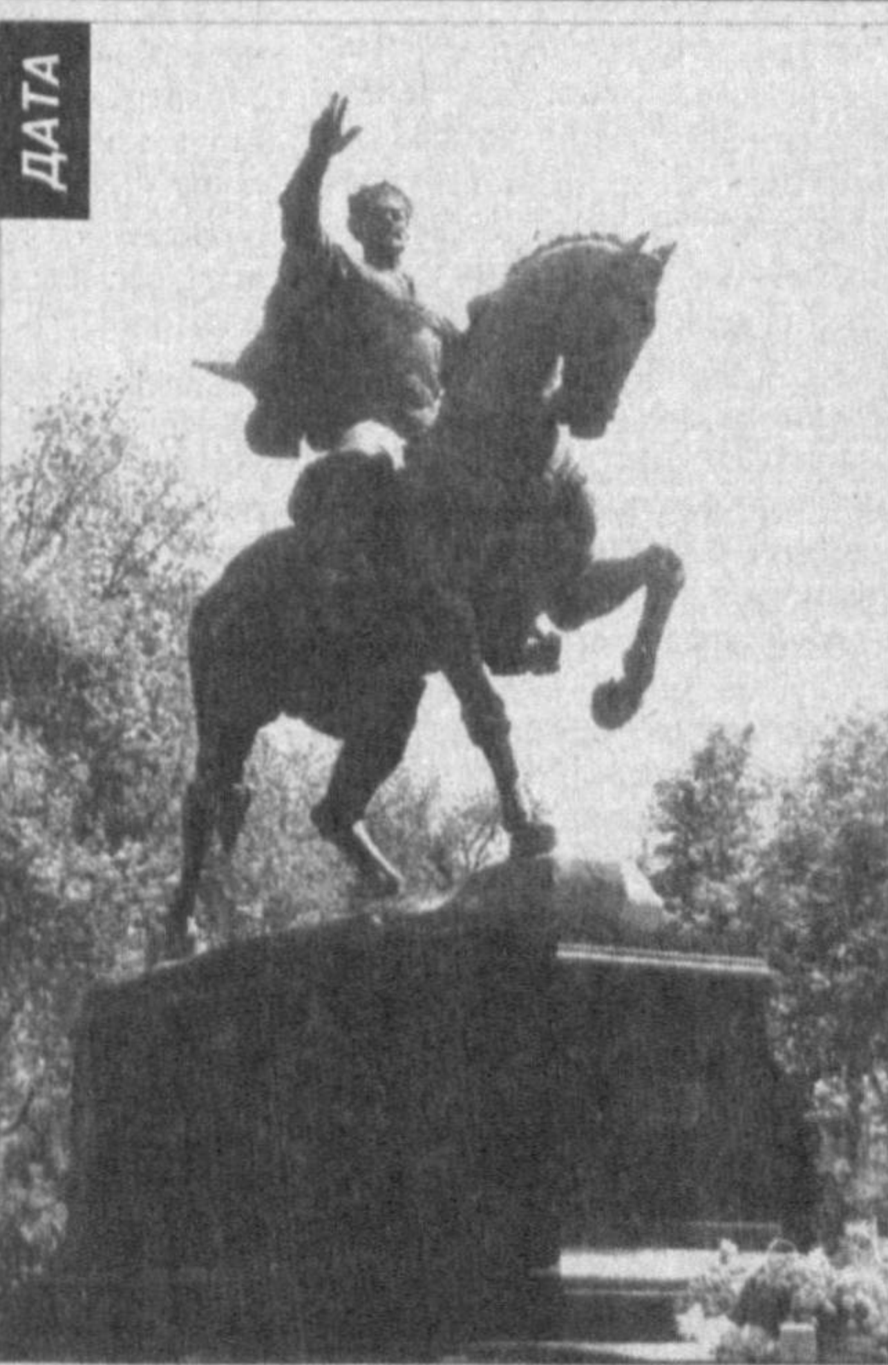
Каждый год 9 апреля - в день рождения Амира Темира в сквере, носимом его имя, бывает особенно многолюдно. И в этот раз уже с раннего утра почтить память великого полководца сюда пришли горожане и гости столицы, представители общественности.