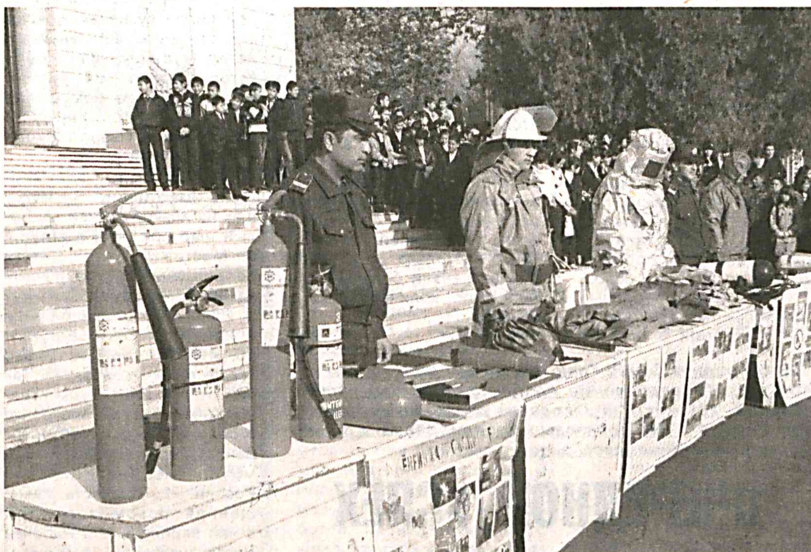
Особое внимание - жилым строениям. Многие собственники жилья, как уже убедились сотрудники службы пожарной безопасности, весьма и весьма далеки от требований безопасности.

а также отопительными электроприборами. Большая часть возгораний происходит в связи с нарушением техники безопасности и всевозможными неполадками, связанными с электропроводкой.