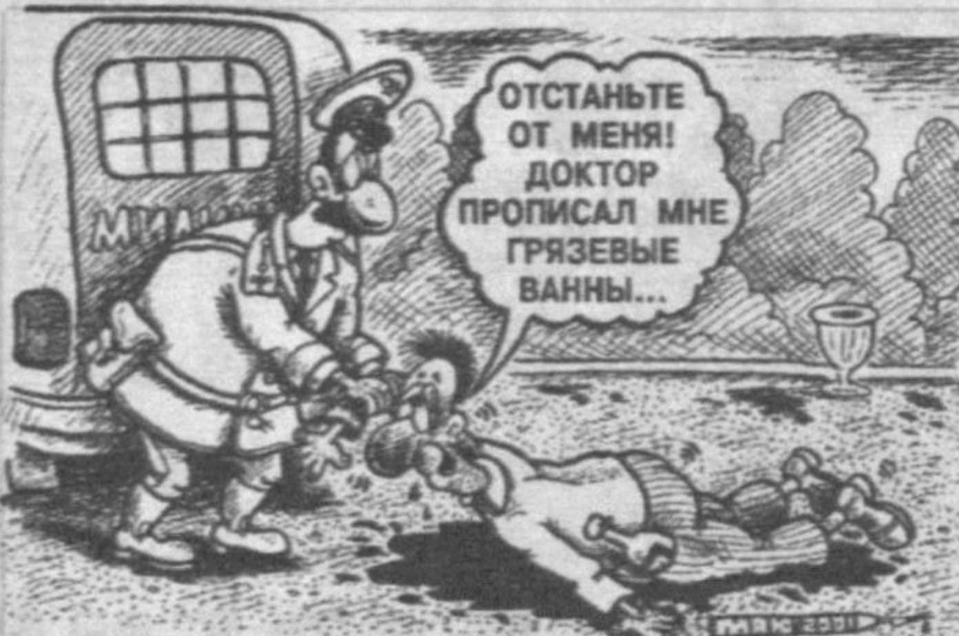
Рис. Александра Маркелова.