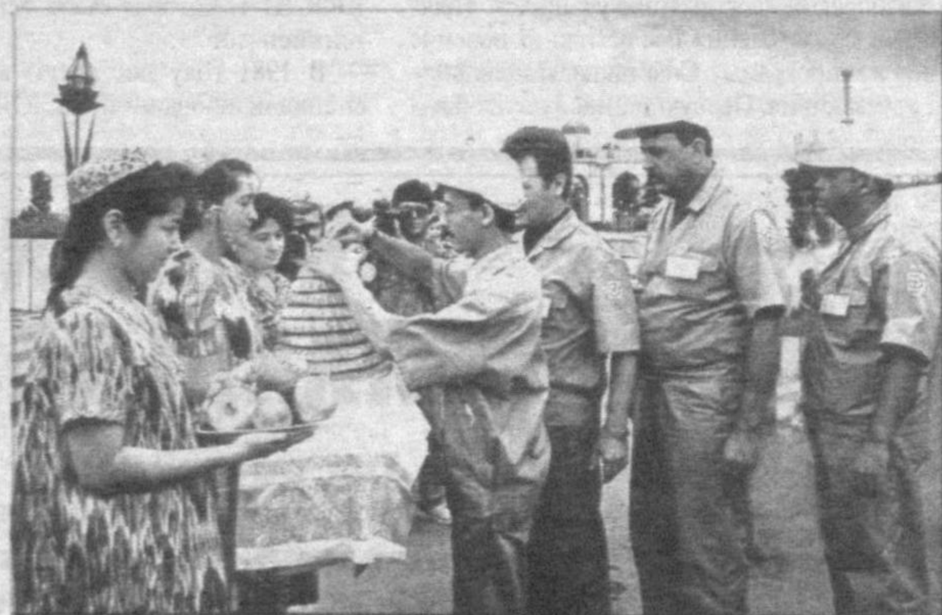
Хлеб да соль, а ты рядом постой.