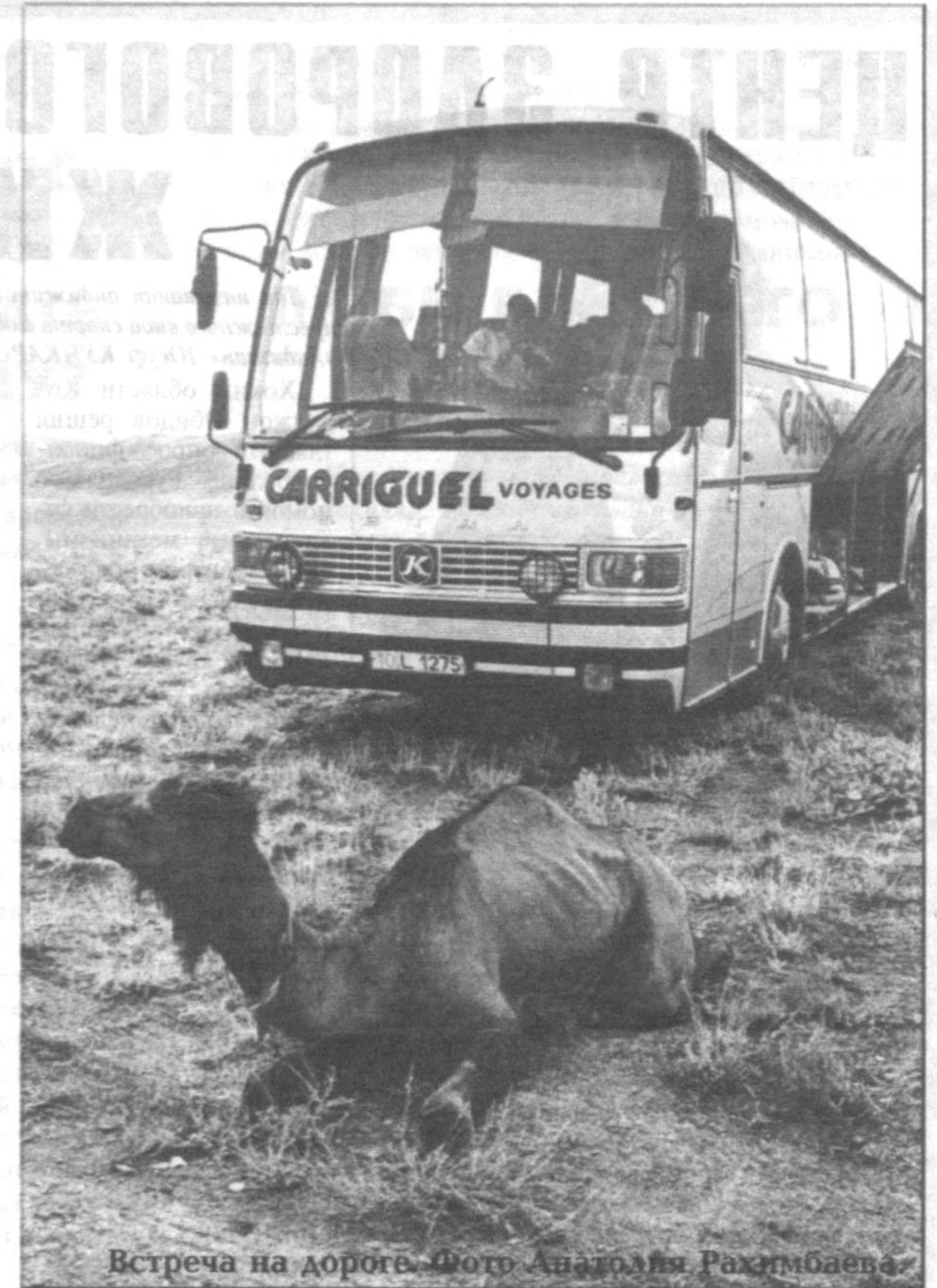
Встреча на дороге.