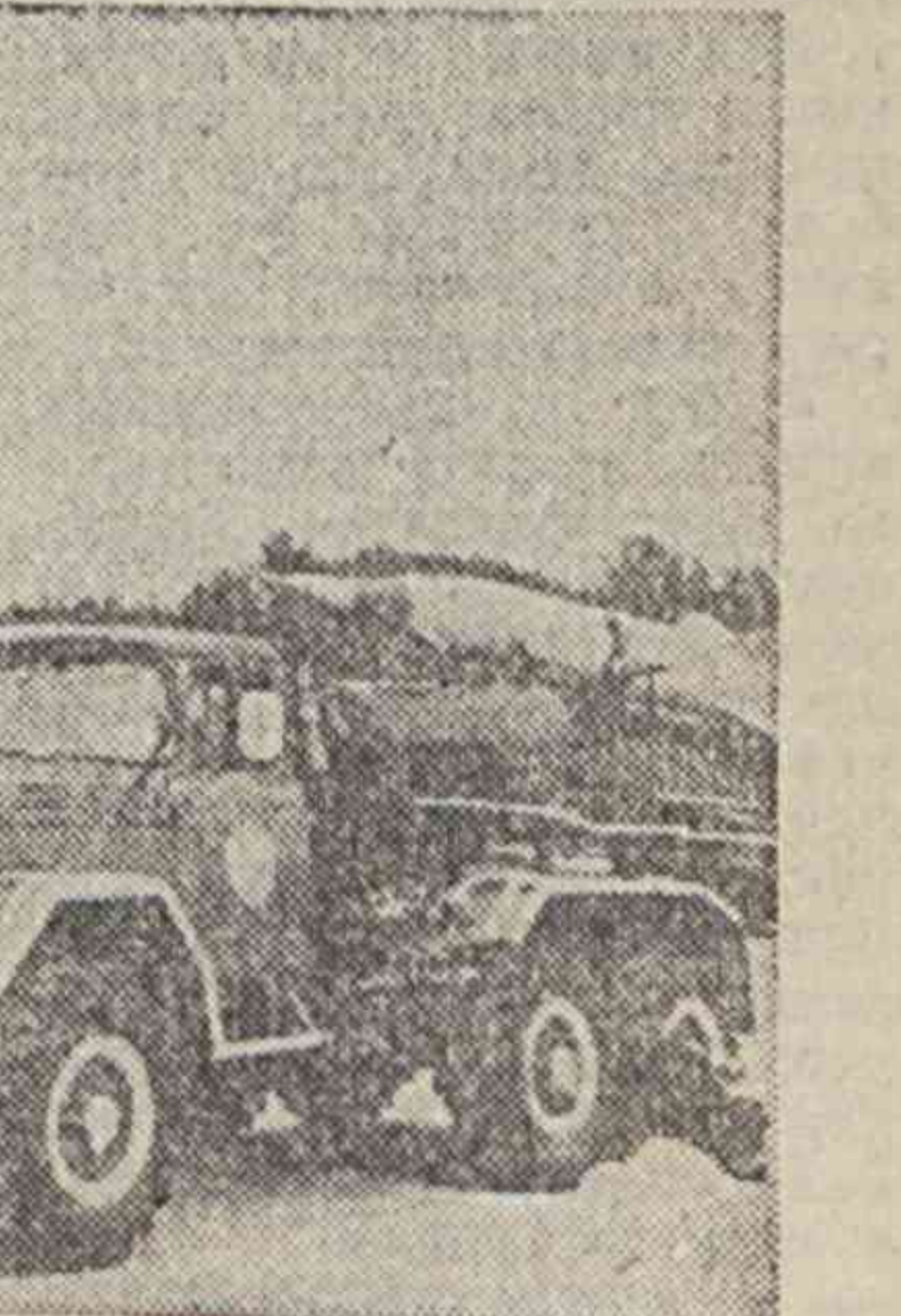
Во время празднования 50-летия Победы на площади Мустақиллик.