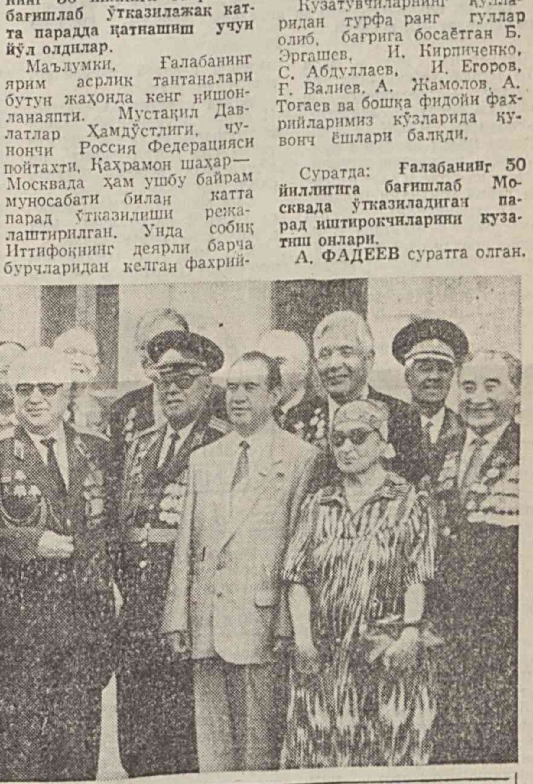
Суратда: Галабанинг 50 йиллиги бағишлаб Москвада ўтказилажак парад иштирокчиларини кузатиш олдари.

Яқинда Ўзбекистон Республикаси Фахрийлар ташкилотлари Уюшмаси био-сидга боғла халқимиз да-ларга бой бўлган ўзинга хос кузатув тадбири ўтказилди. Она-Ватанимизнинг деярли барча вилоятларидан таъриф буюртган 18 нафар Қаҳрамон, 13 нафар Шўҳрат орденининг тўла нишондорларини бўлмиш фахрий отахонларимиз ушбу тадбирнинг асосий сабабчилари бўлдилар. Босе, улар Москвага — фашизм устидан қозонилган Галабанинг 50 йиллиги байрамига бағишлаб ўтказилажак катта парадда қатнашиш учун йўл олдлар. Маълумки, Галабанинг ярим асрлик таънавлари бутун жаҳонда кенг нишонланапти. Мустафи Давришнинг Ҳамдўстлиги, қуночи Россия Федерацияси пойтахти, Қаҳрамон шаҳар — Москвада ҳам ушбу байрам муносабати билан катта парад ўтказилиши река-лаштилган. Унда совиқ Иттифокнинг деярли барча бурчларидан келган фахрий-