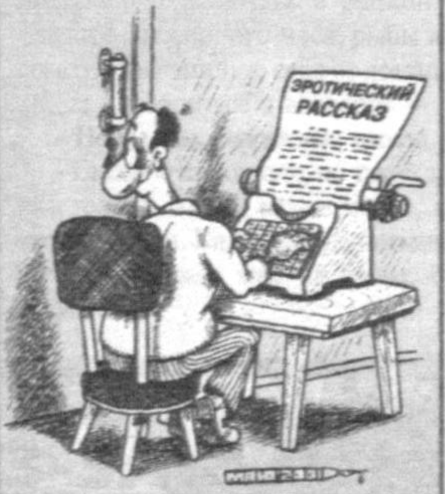
Рис. Александра Маркелова.