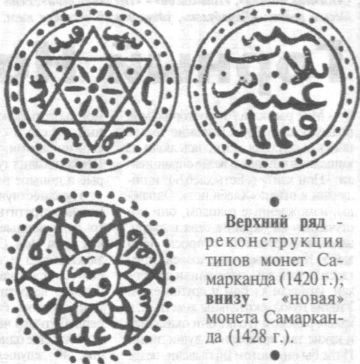
Верхний ряд - реконструкция типов монет Самарканда (1420 г.); внизу - «новая» монета Самарканда (1428 г.).

Продуманность великим ученым всех деталей предстоящей реформы, вплоть до мелочей, видна по следующему факту. Чтобы обеспечить одновременность выпуска денег на всей территории государства, Улугбек приказал доставить монетные штампы во все крупные города государства. В этих городах одновременно начали чеканить монеты, а когда необходи-