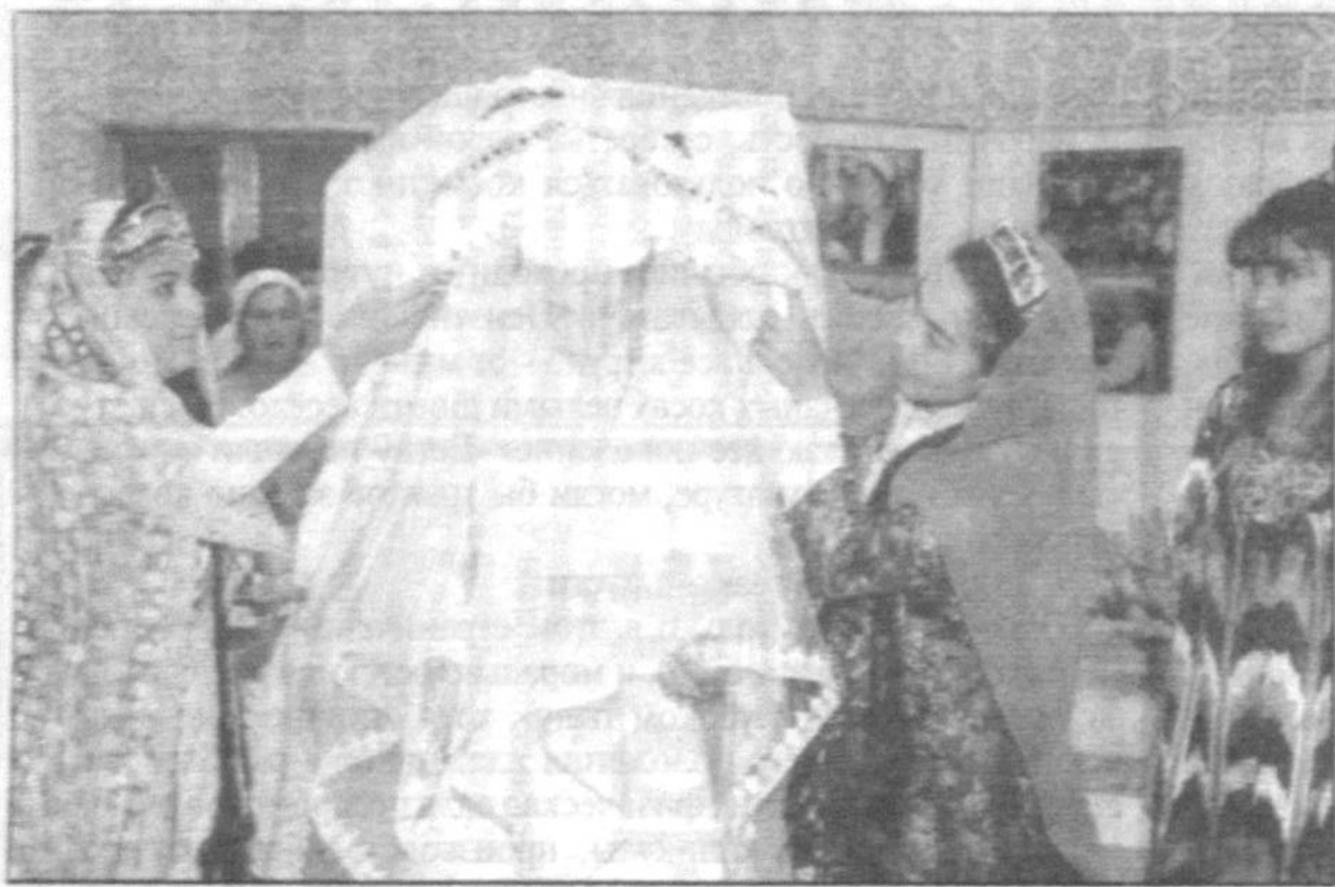
Сегодня - невеста, завтра - жена!