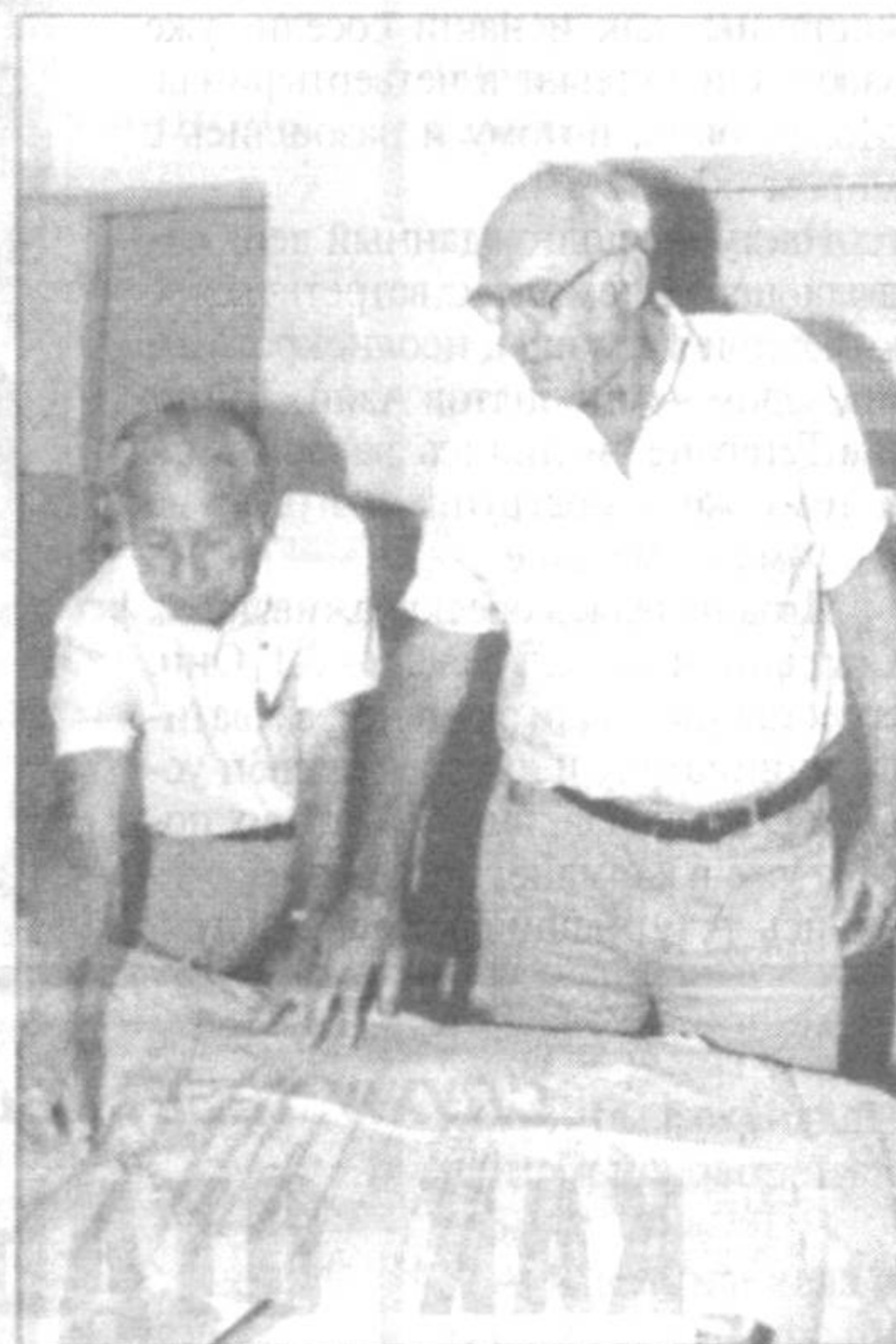
ЮНУСАБАДСКАЯ ЛИНИЯ МЕТРО