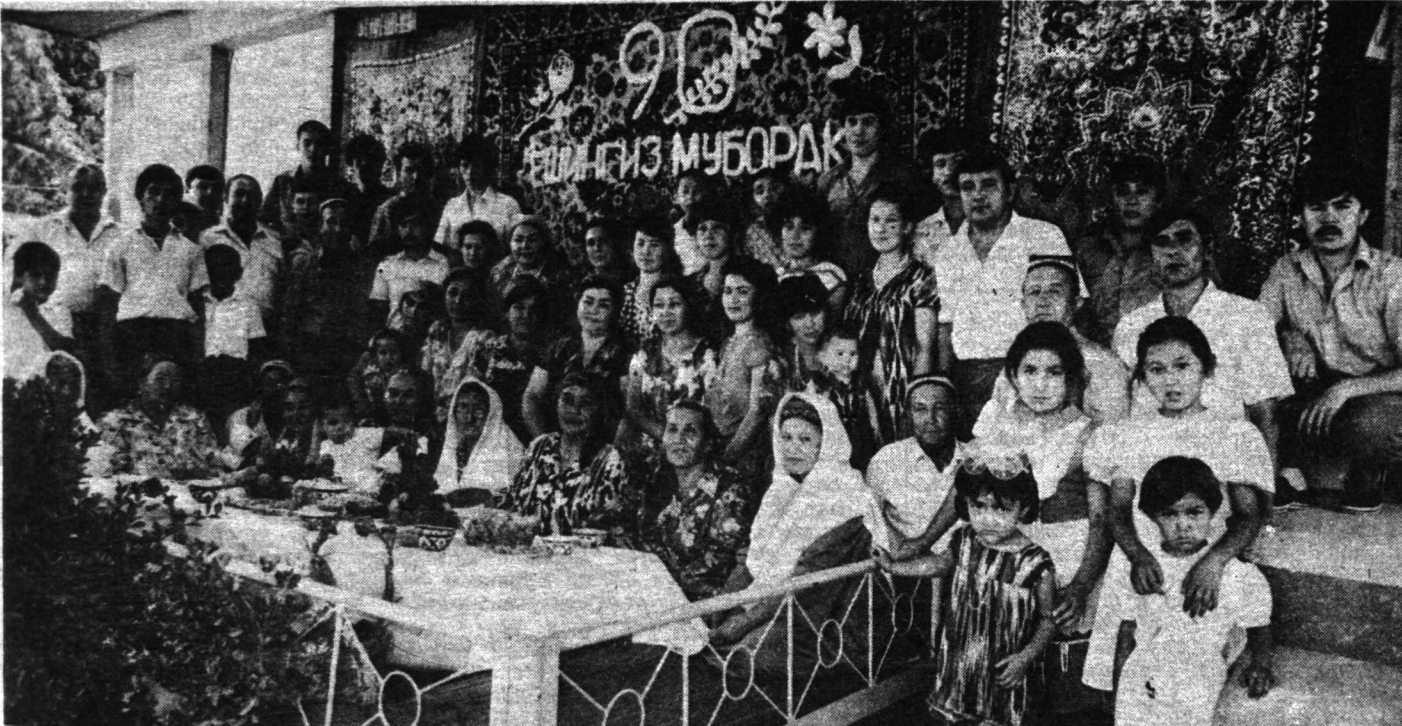
Бўстон буви онласи даврасида.

Кунни кеча катта онла яна дастурхон атрофида тўпланишди. Бўстон бувини муборак тўқсон ёши билан қутлашди. У ҳаётга шундай чанқоқ эканки, бошидан ўтказган беҳисоб кулфатларга қарамасдан ҳам тетик.