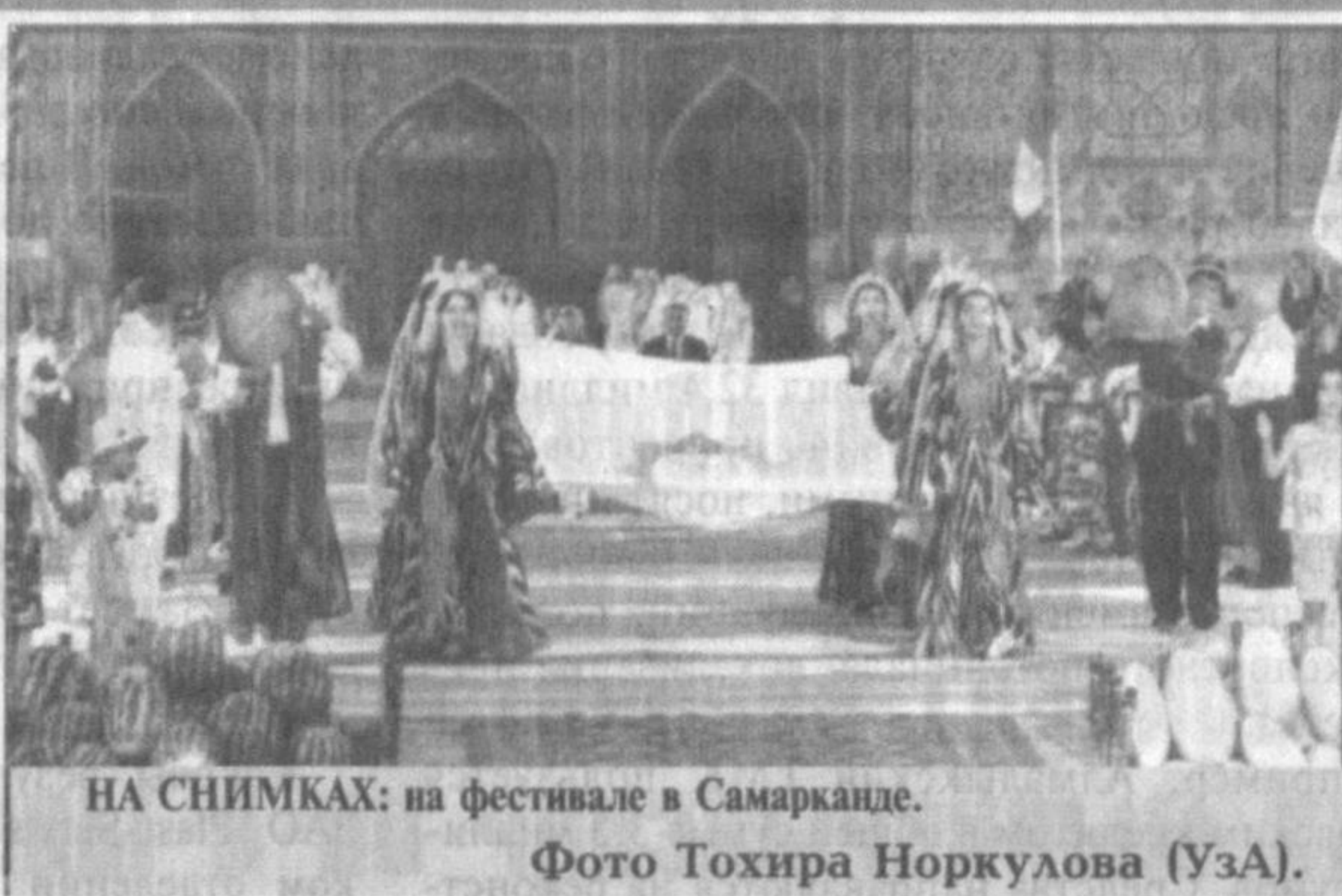
НА СНИМКАХ: на фестивале в Самарканде.