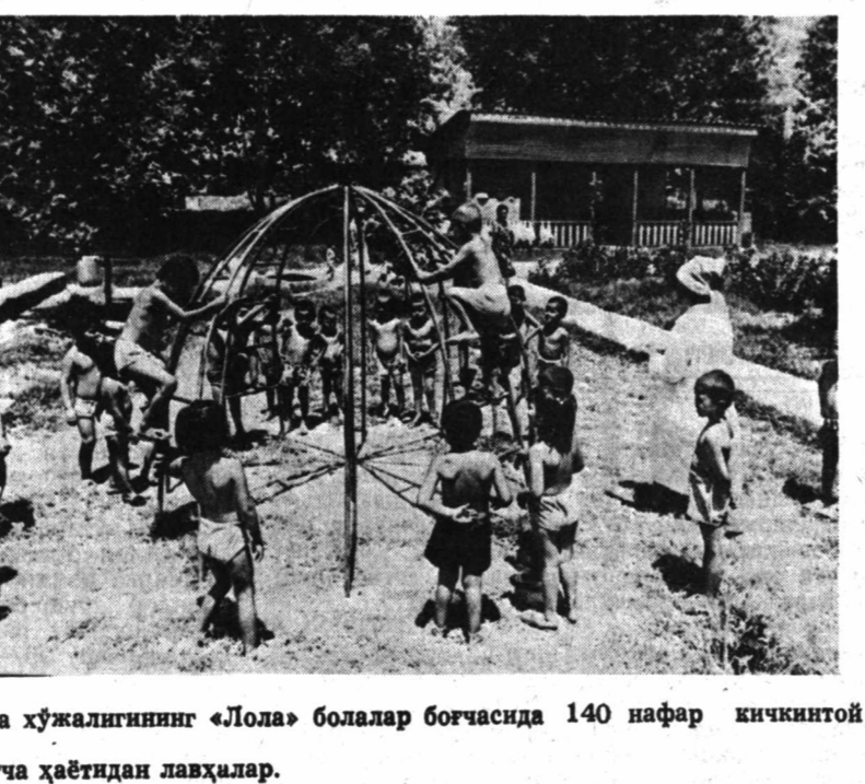
ПИСКЕНТ райондаги «Ўзбекистон ССР 50 йиллиги» жамоа ҳужалигининг «Лола» болалар боғчасида 140 нафар кичкинтой тарбияланмоқда. Бу ерда болаларнинг яйрашлари учун барча қулайликлар бор.