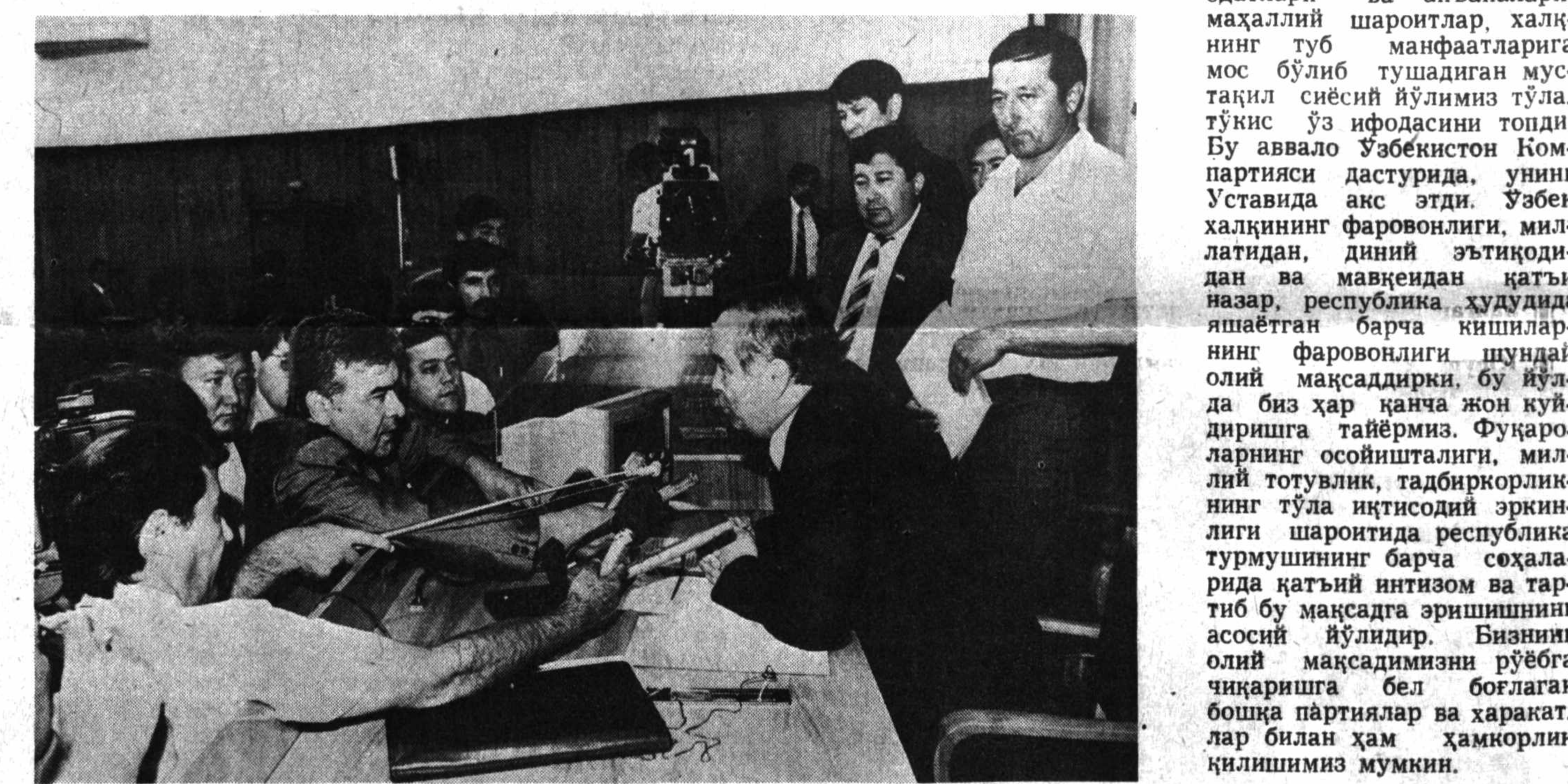
Жумҳуриятимиз пойтхотида Ўзбекистон Республикаси Олий Кенгашининг навбатдан ташқари VI сессияси бўлиб ўтди. Суратда: мажлистан сўнг.

Журналистлар билан учрашувда қаламқашларнинг бошқа кўпдан-кўп саволларига ҳам батафсил жавоб берилди. (ЎзТАГ).