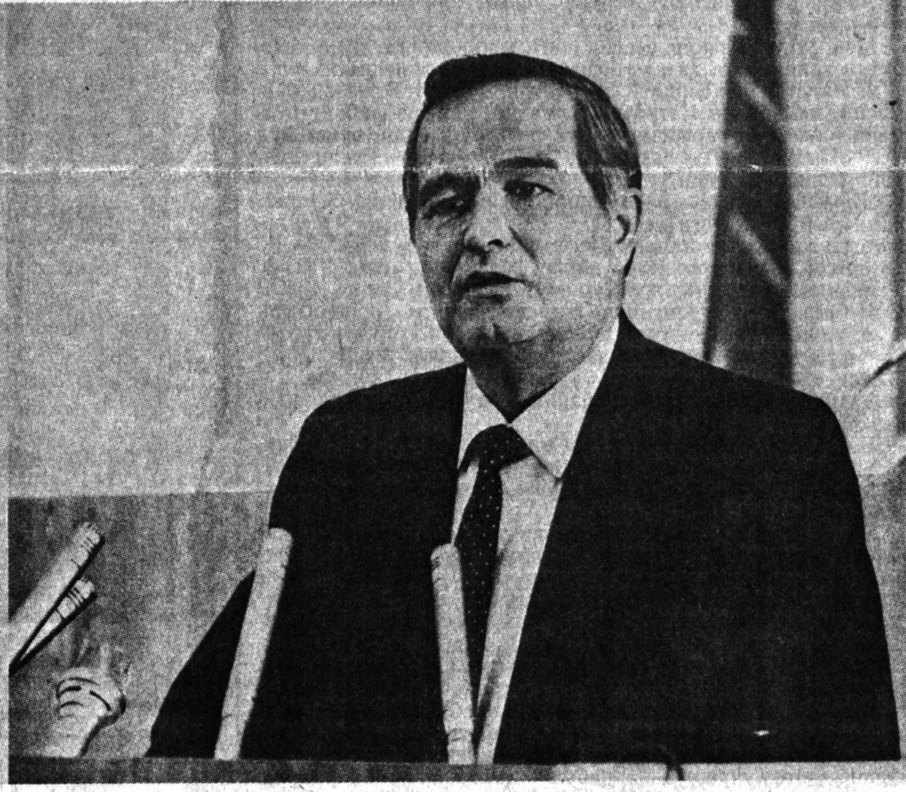
● Тошкент, 1991 йил 31 август. Ўзбекистон Республикаси Олий Кенгашининг навбатдан ташқари сессиясида. Минбарда жумҳуриятимиз Президенти И. А. Каримов.