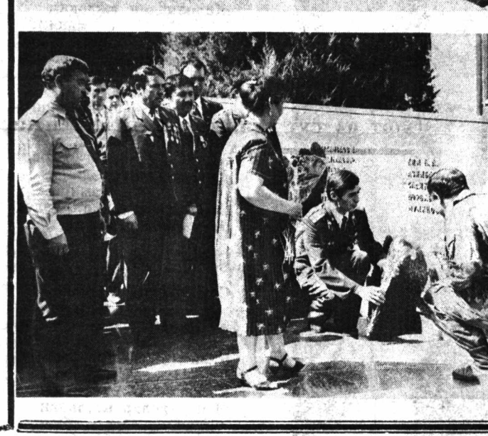
Суратларда: конференциядан лавҳалар.