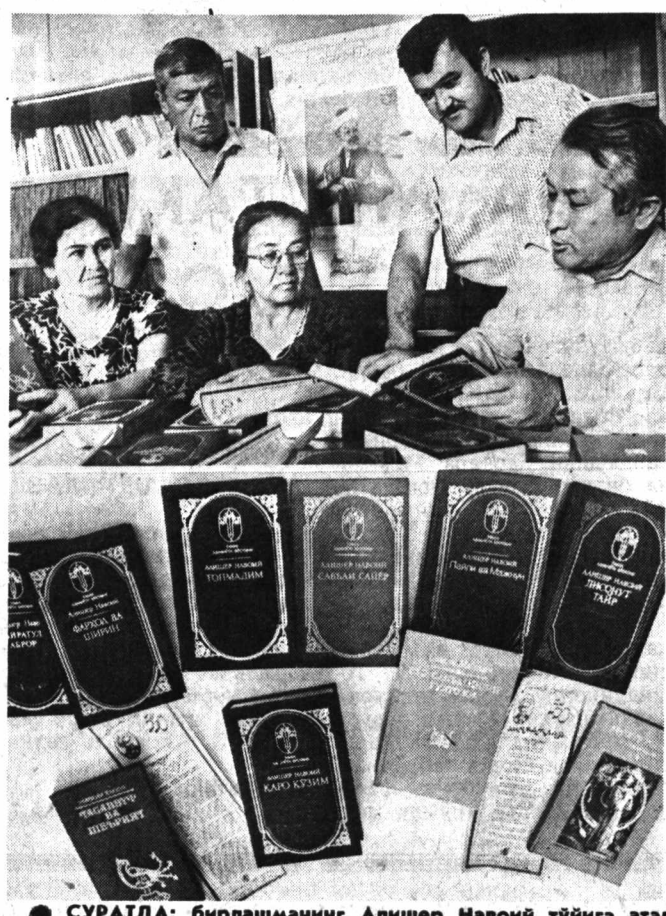
СУРАТДА: Ўзбекистоннинг Алишер Навоий тўғрисидаги атам...