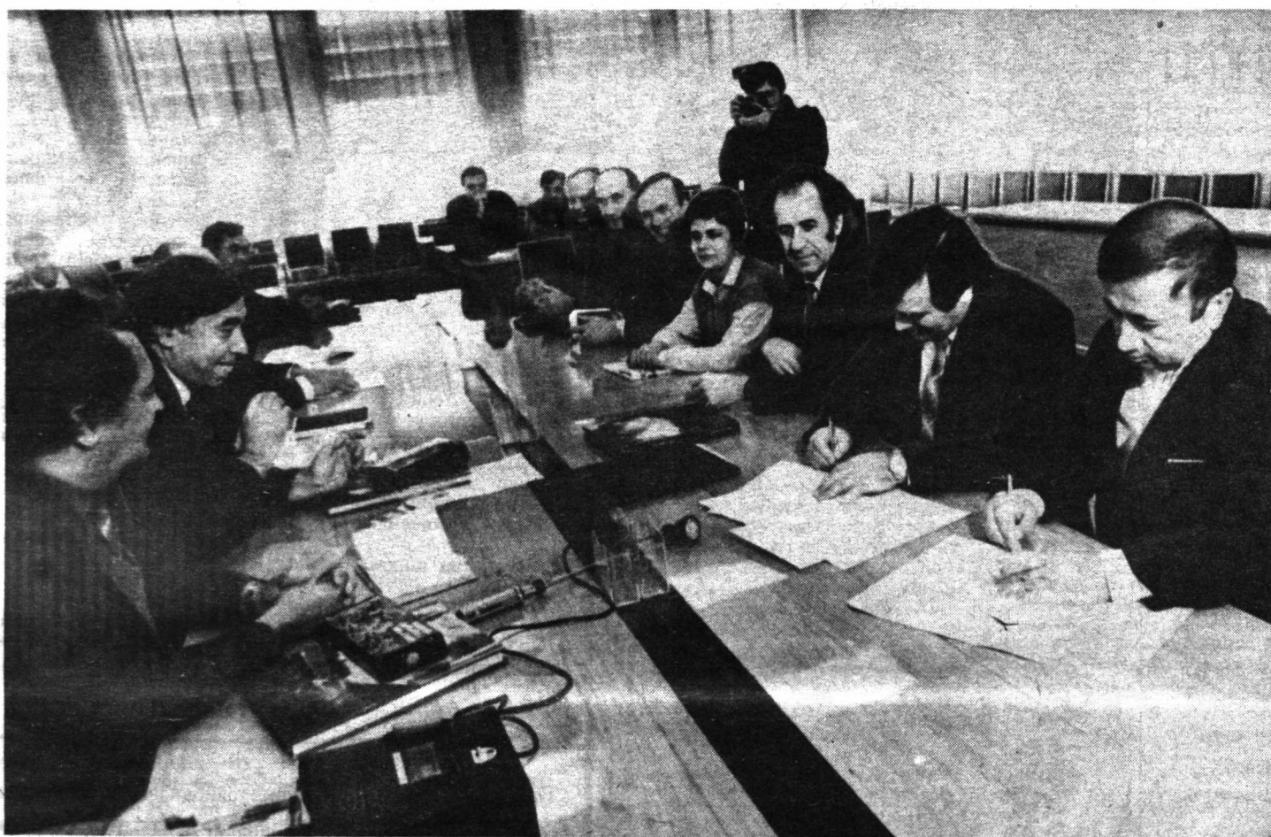
СУРАТДА: музокара пайти.