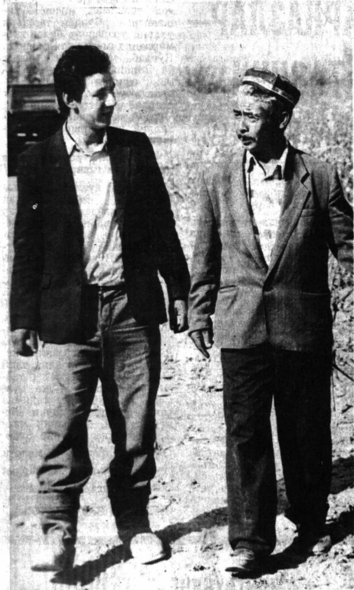
МАНА, дастлабки катта хушхабар. Ғалаба ноҳияси деҳқонлари вилоятда биринчи бўлиб йиллик пахта тайёрлаш режасини бажаришди. Йил бошдан буён кўз тикиб келинган марра