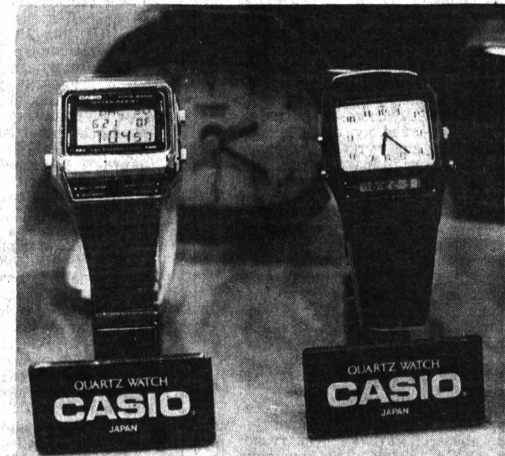
СУРАТЛАРДА: қўшқичқар мамлакат маҳсулотлари ҳалқимизнинг қизиқиши катта; кўргазмага таширф бурурсангиз мана шундай техника намуналари билан танишишга муяссар бўласиз.