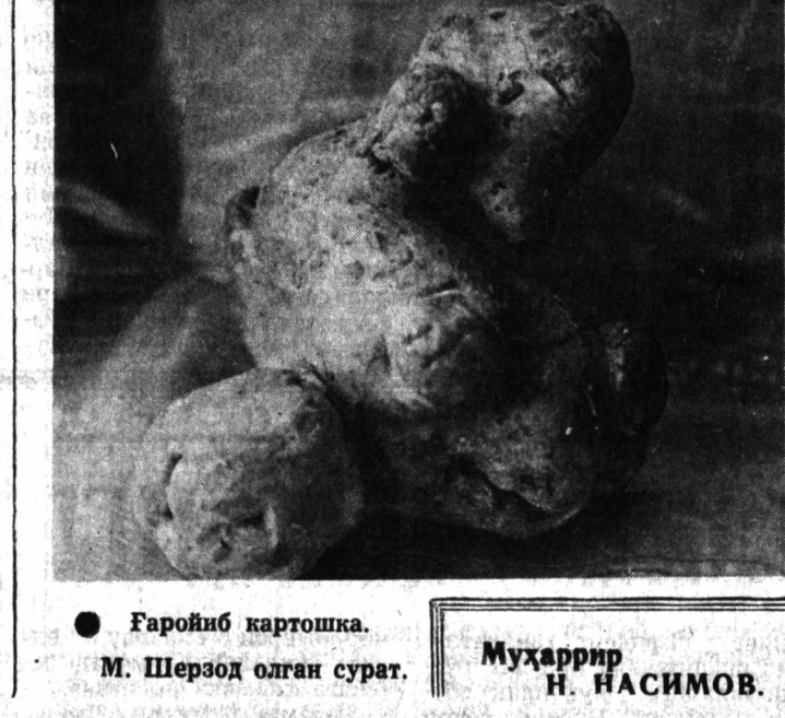
● Фаройиб картошка. Мухаррир Н. НАСИМОВ.

Копенгаген бургомистри Ларс Энгберг «Сув парисининг сафарга чиқиши» тўрисидаги масала муҳокамасига яқун ясаб, кўп гапирмади: «Миллий хазина дейди бўлмаслиги лозим». Балки, у ҳақдир. Чунки Сув парисининг ҳаёти шунис ҳам саргузаштларга жуда бой бўлган. Бу саргузаштларнинг баъзилари фожиа билан тугашига оз қолган.