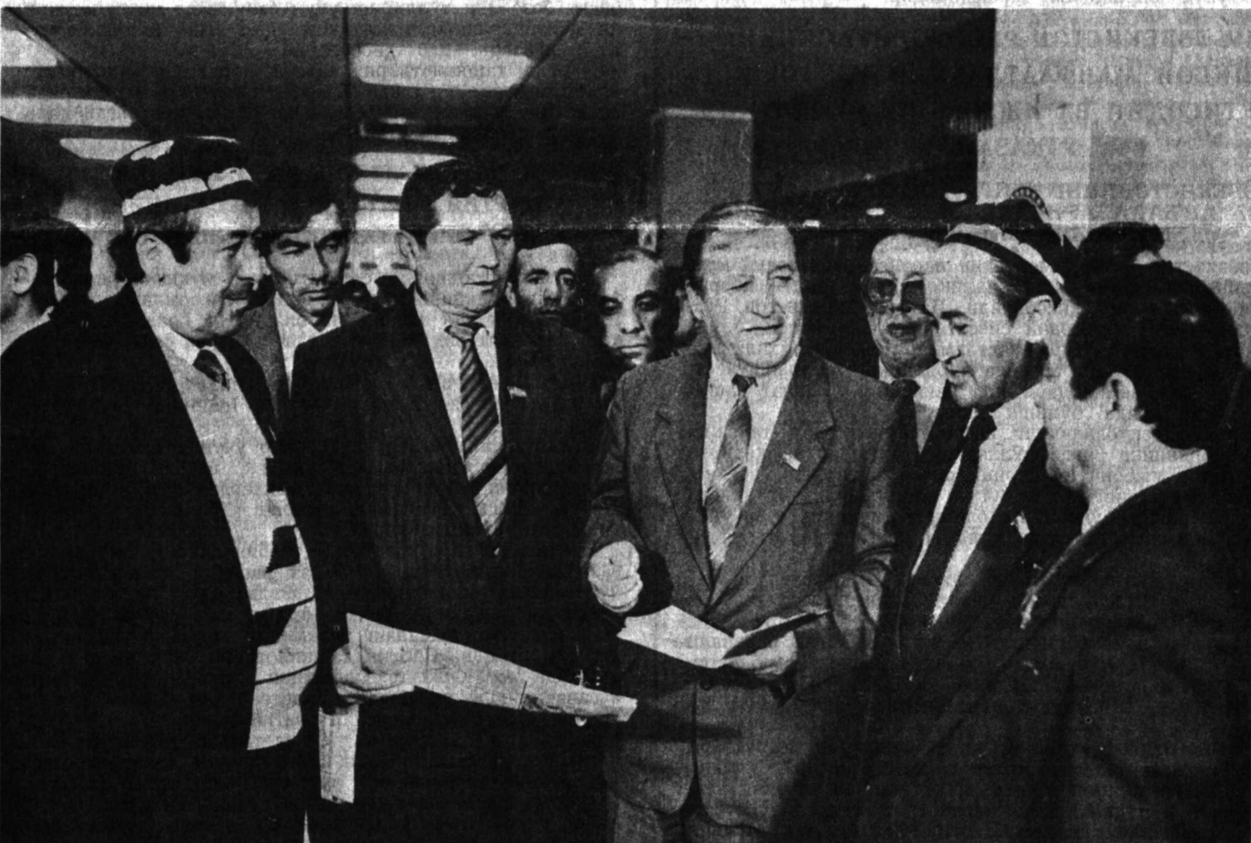
● СУРАТДА: сессия қатнашчилари ўзаро мулоқотда.